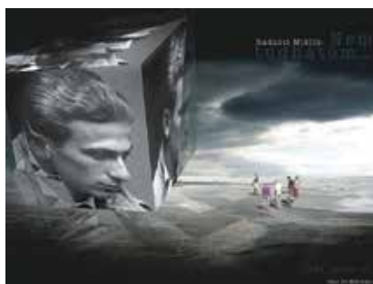
Fotó: Paul ter Wal

Ki géppel száll fölébe – Hommage à Radnóti Miklós címmel a Magyar Elektrográfiai Társaság kiállítása látható 2019. május 14. és augusztus 31. között az Eötvös10 Közösségi és Kulturális Színtér földszinti aulájában. (Budapest VI. ker., Eötvös u. 10.) A képen Paul ter Wal műve.