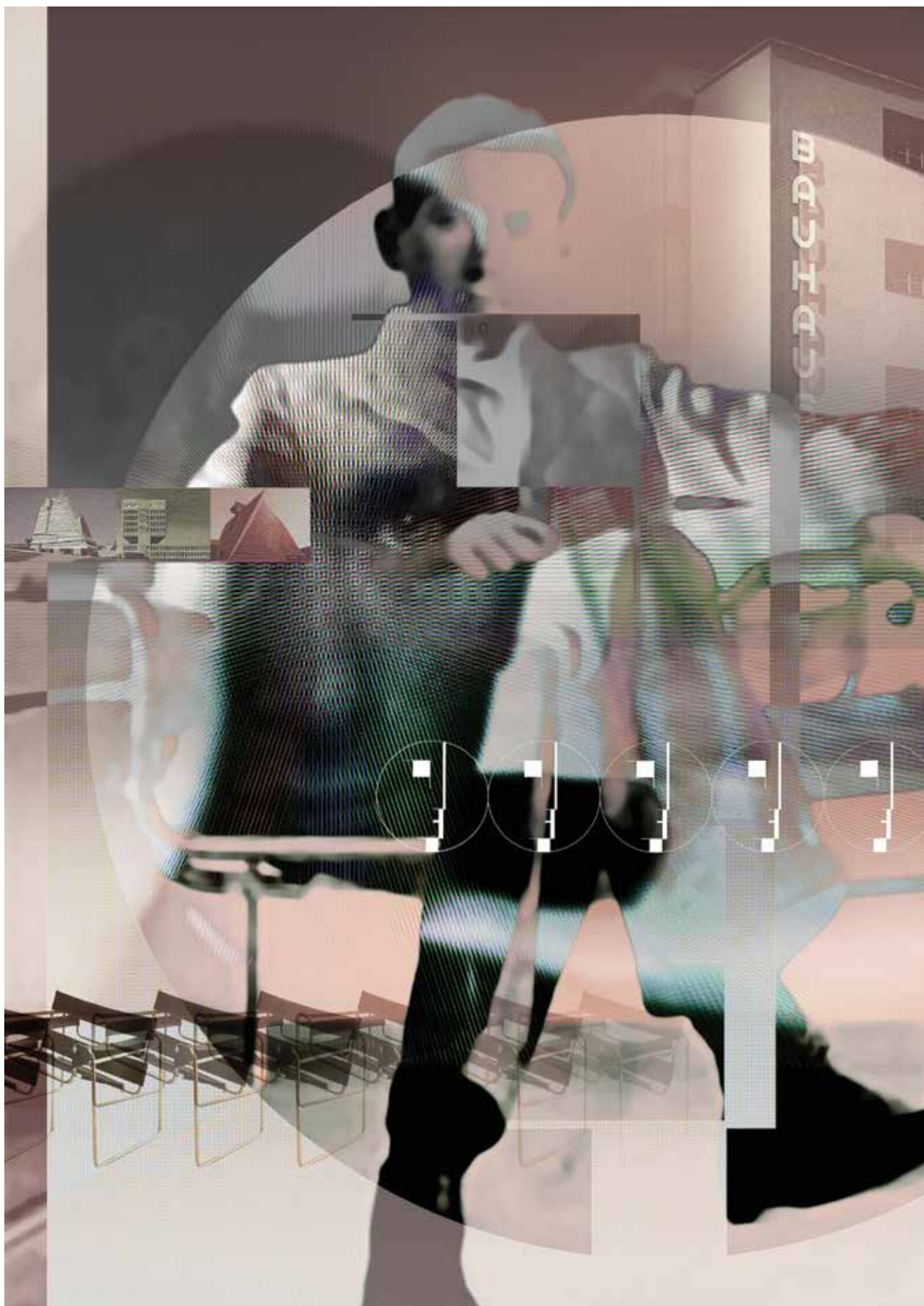
KULINYI István: Breuer Marcell 1902–1981, emléklap | István KULINYI: Marcel Breuer 1902–1981, memorial card 2019, digitális montázs, 70x50 cm