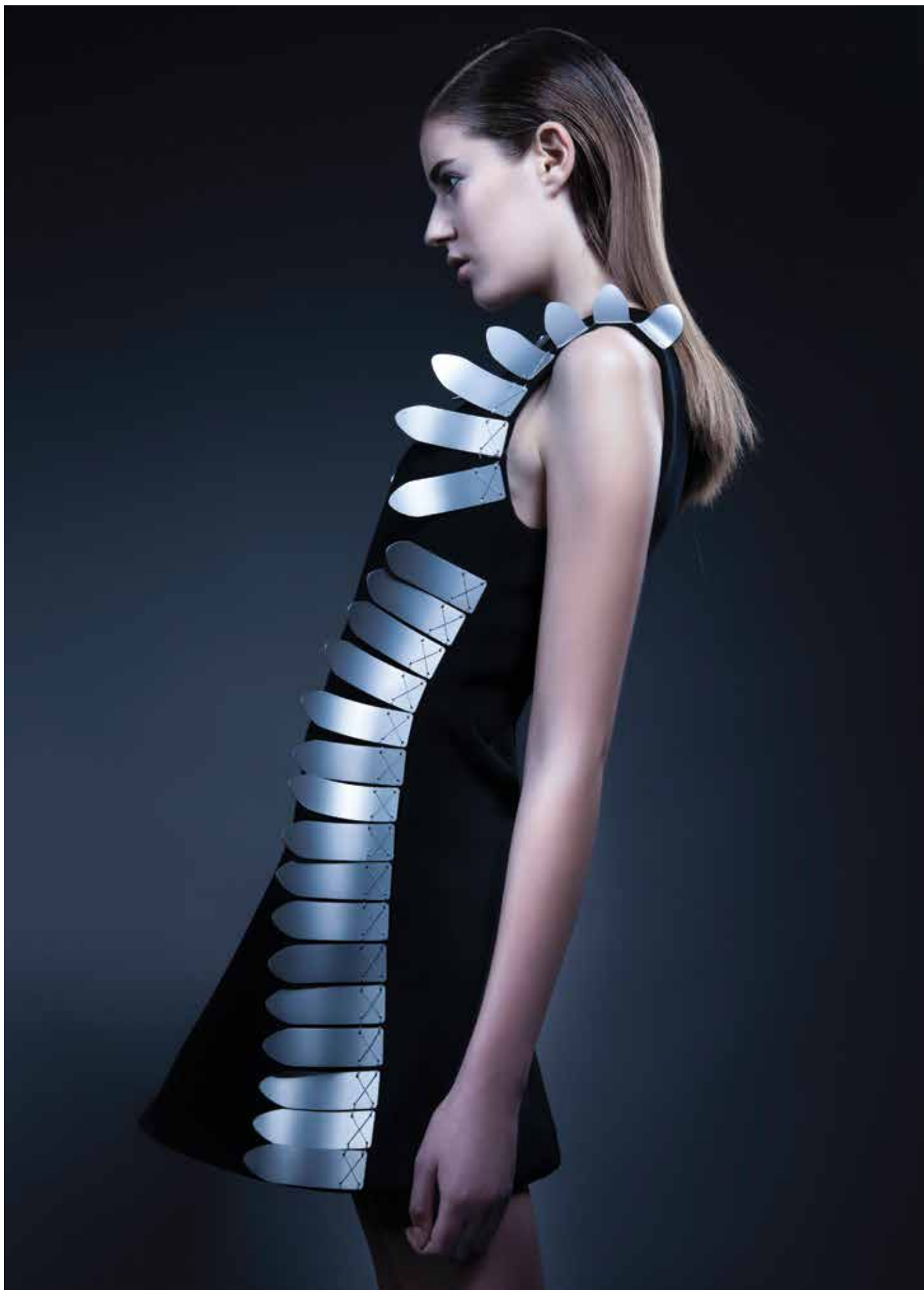
KALICZ-MÉSZÁROS Klára: Lélekkérgék – női öltözék | Klára KALICZ-MÉSZÁROS: Soul crusts – woman's outfit | 2018, textil, fém

(Cikkünk a 17. oldalon)