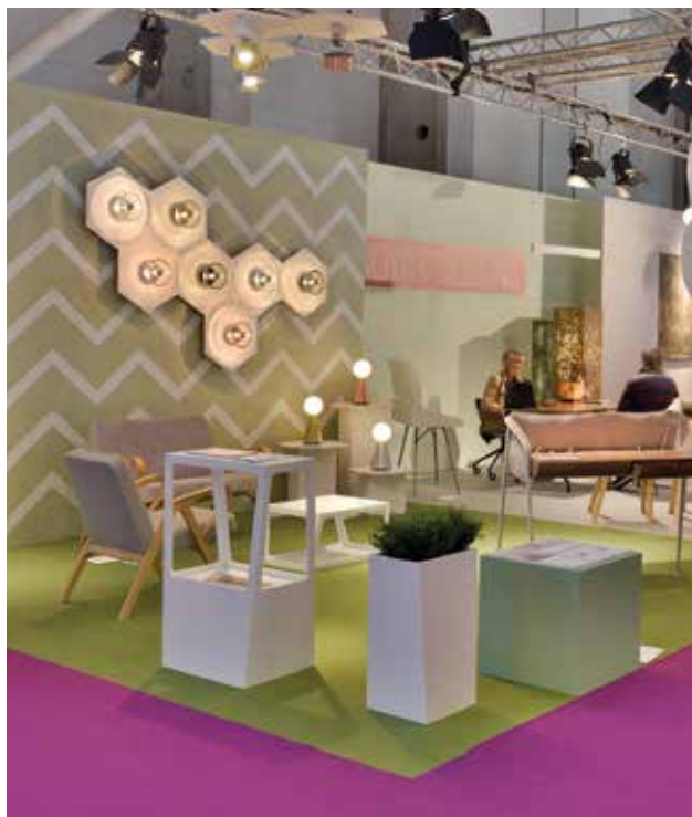
Magyar Design stand | Hungarian Design stand OTTHONDesign kiállítás, CONSTRUMA 2019, Hungexpo, Budapest, 2019