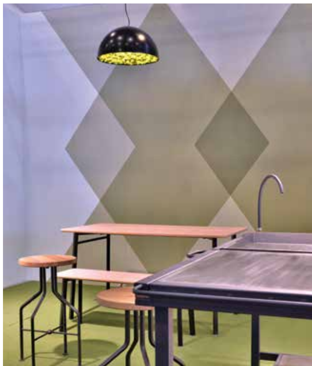
PATAKI Dávid (PDSIGN): ROCK@ bárszék; Ramón NIETO (Nieto Light): FARMOSA lámpa; MILETICS Attila: AKALI kültéri asztal és pad; GYŐRE Máté András: Flip kültéri asztal közösségi kertekbe Dávid PATAKI (PDSIGN): ROCK@ bar stool; Ramón NIETO (Nieto Light): FARMOSA lamp; Attila MILETICS: AKALI outdoor table and bench; Máté András GYŐRE: Flip outdoor table for communal gardens