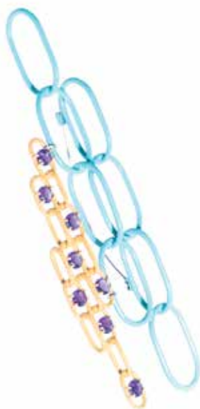
TENGELY Nóra: Brass | Nóra TENGELY: Brooch 2018, színterezett sárgaréz, ametiszt, forrasztott lánc, 10x4x1,5 cm