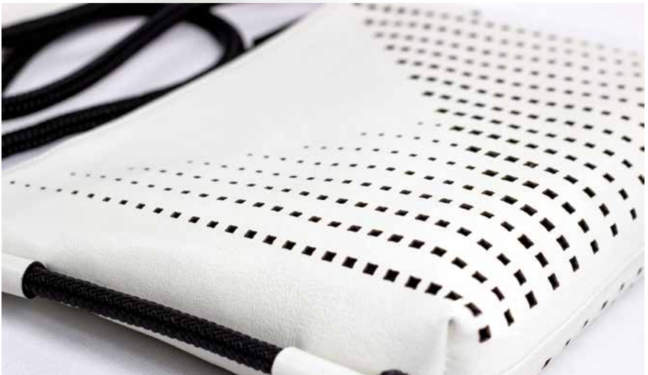
NAGY Krisztina: Vintage bőrkabátból lézervágott bőr borítektáska Krisztina NAGY: Leather clutch bag laser-cut from a vintage leather coat 2018, 20x25x5 cm ∨