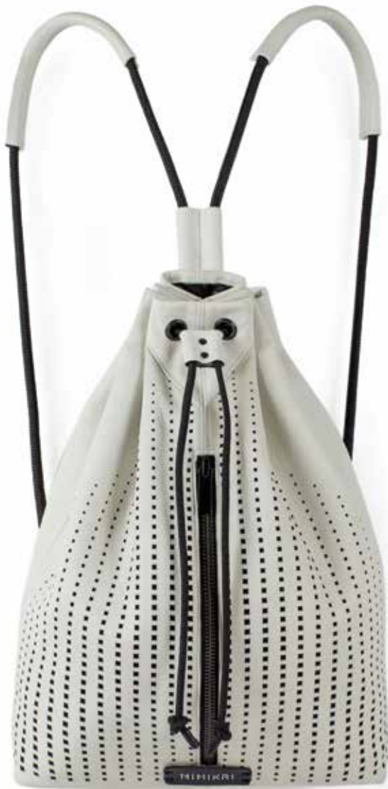
◀ NAGY Krisztina: Vintage bőrnadrágból újrahasznosított, lézervágott bőr hátizsák Krisztina NAGY: Leather rucksack recycled (laser-cut) from vintage leather trousers 2018, 41x36x10 cm