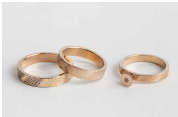
JUHOS Janka: JUJJ Jewellery – eljegyzési gyűrű és jeggyűrűpár, Pearl Set Janka JUHOS: JUJJ Jewellery – engagement ring and pair of wedding rings, Pearl Set | 2018, rozéarany, gépi vésés

2018, fehérarany, gépi vésés