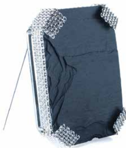
TENGELY Nóra: Brass | Nóra TENGELY: Brooch 2018, 926-os ezüst, pala, forrasztott lánc, 7x5x1,5 cm