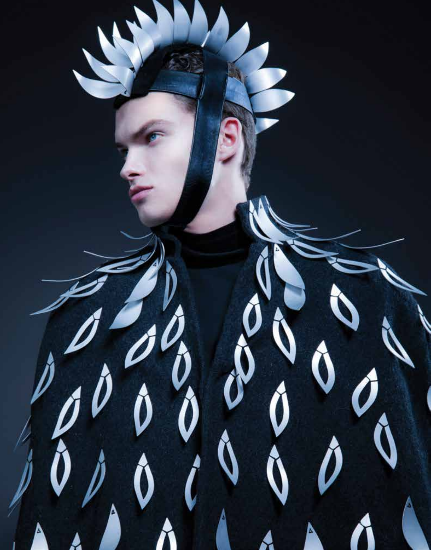
KALICZ-MÉSZÁROS Klára: Lélekkérgék – férfiöltözék | Klára KALICZ-MÉSZÁROS: Soul crusts – man's outfit | 2018, textil, fém