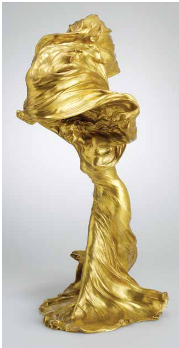
Raoul François Larche: Asztali villanylámpa – Loïe Fuller táncosnő alakjával Raoul François Larche: Electric table lamp – with the figure of dancer Loïe Fuller

A műtárgyról szemrevételezéssel nyerhető információk bővítéséhez a muzeológus háttérkutatása szükséges. Az attribúció – az alkotók meghatározása – mellett a készítés idejének és a tárgy származásának, gyűjteménybe kerülésének – provenienciájának – megismerése a cél. Évszámjelölés híján az eddigi ismeretekből, jelzésekből tudunk kiindulni.