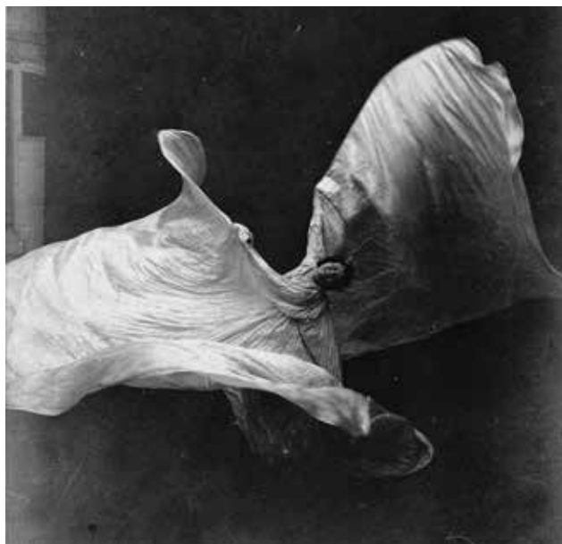
Isaiah West TABER: Loïe Fuller fátyoltánca (Loïe Fuller dansant avec son voile) Isaiah West TABER: Loïe Fuller's serpentine dance 1897, archív fotó (Musée d'Orsay, Párizs) © Photo: Musée d'Orsay, Paris

A lámpa tervezője a szecesszió korának egyik ismert szobrásza, Raoul François Larche (1860–1912), kivitelezője az 1860-ban alapított Siot-Decauville öntőcég, Párizsban a 19–20. század fordulóján kis híján ezer bronzöntő műhely működött. A közülük művészi színvonalban kiemelkedő, az 1900. évi párizsi világkiállításon nagydíjat nyert cég erre az alkalomra katalógust adott ki, melynek képei között ezé a lámpáé is föltűnik.