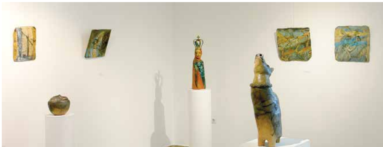
KUN Éva Útközben című kiállítása (részlet) | Éva KUN: 'Along the Way'. Exhibition view | Udvarház Galéria, Veregyháza, 2018