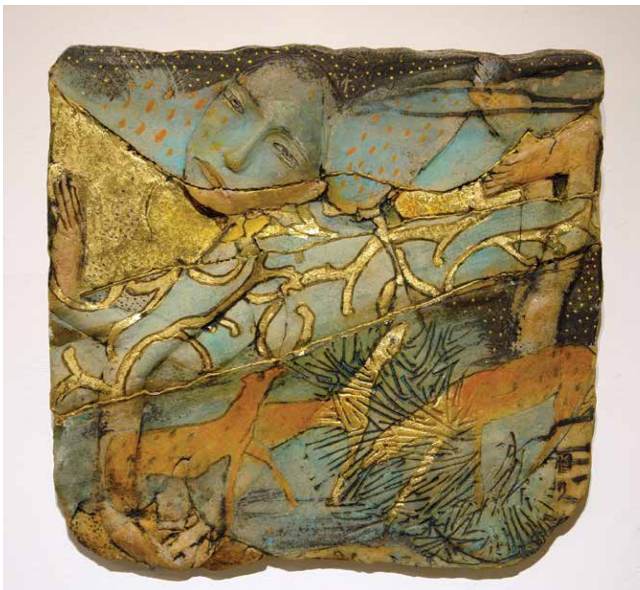
KUN Éva: Állatsirató, dombormű | Éva KUN: Lament for animals. Relief | 2003, samott, festett, mázazott, aranyozott, 1250 °C, 45x45x0,8 cm