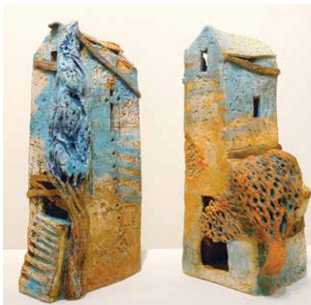
KUN Éva: Mediterrán házak I–II. | Éva KUN: Mediterranean houses I–II 2012–2013, samott, szabad kézzel mintázott, festett, 1220 °C, 40x22x12 cm, 37x20x15 cm

Az 1100–1250 Celsius-fokon kiégetett művein ciklikusság figyelhető meg, Kun Éva évek múltával is visszatér egy-egy témakörhöz.