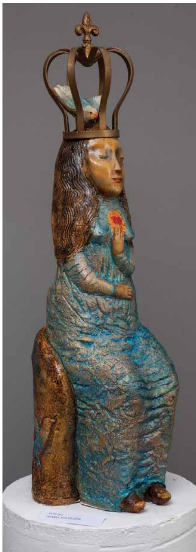
KUN Éva: Mária küldetése | Éva KUN: Mary's mission 2018, samott, szabad kézzel mintázott, festett, 1150 °C, 50x22x22 cm

– ritmikusan váltogatta egymást, mivel a rendezők nem az időrendiségre, nem a tematikára, hanem a látvány összehatására törekedtek.