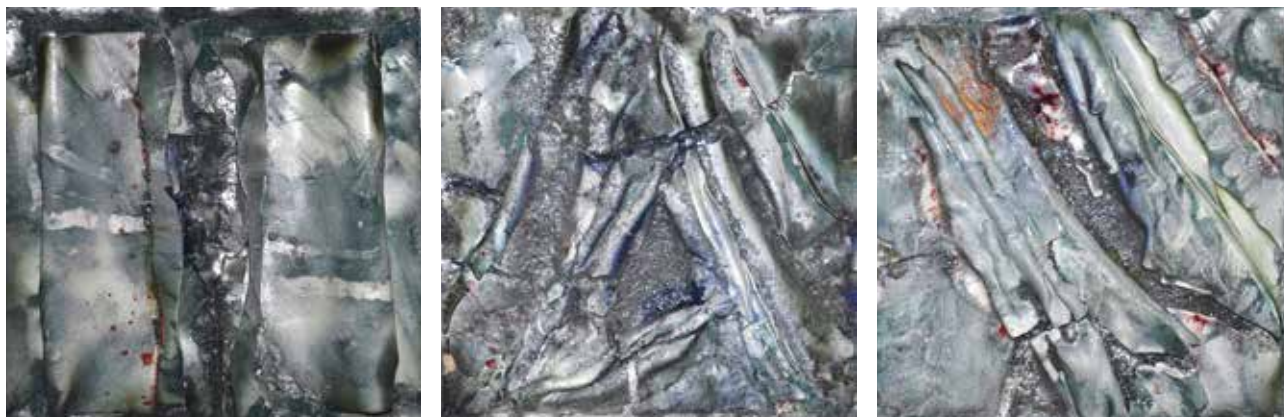
PANNONHALMI Zsuzsa: Olvadás I–III. | Zsuzsa PANNONHALMI: Thaw I–III | 2018, porcelán, mázazott, egyenként 30x30 cm