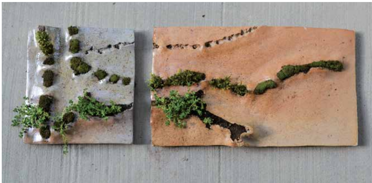
FÜRÓ Bernadett: Semmi-minden I–II. | Bernadett FÜRÓ: Nothing–Everything I–II | 2018, kerámia, mázazott, moha, 20x18 cm és 20x34 cm