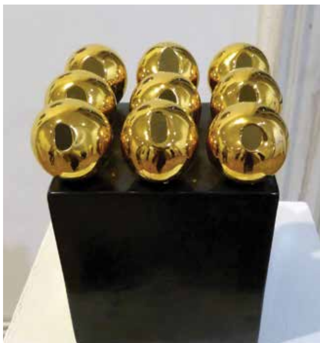
SEGESDI Bori: Kórus | Bori SEGESDI: Choir 2018, porcelán, öntött, fekete és arany máz, magasság: 17 cm