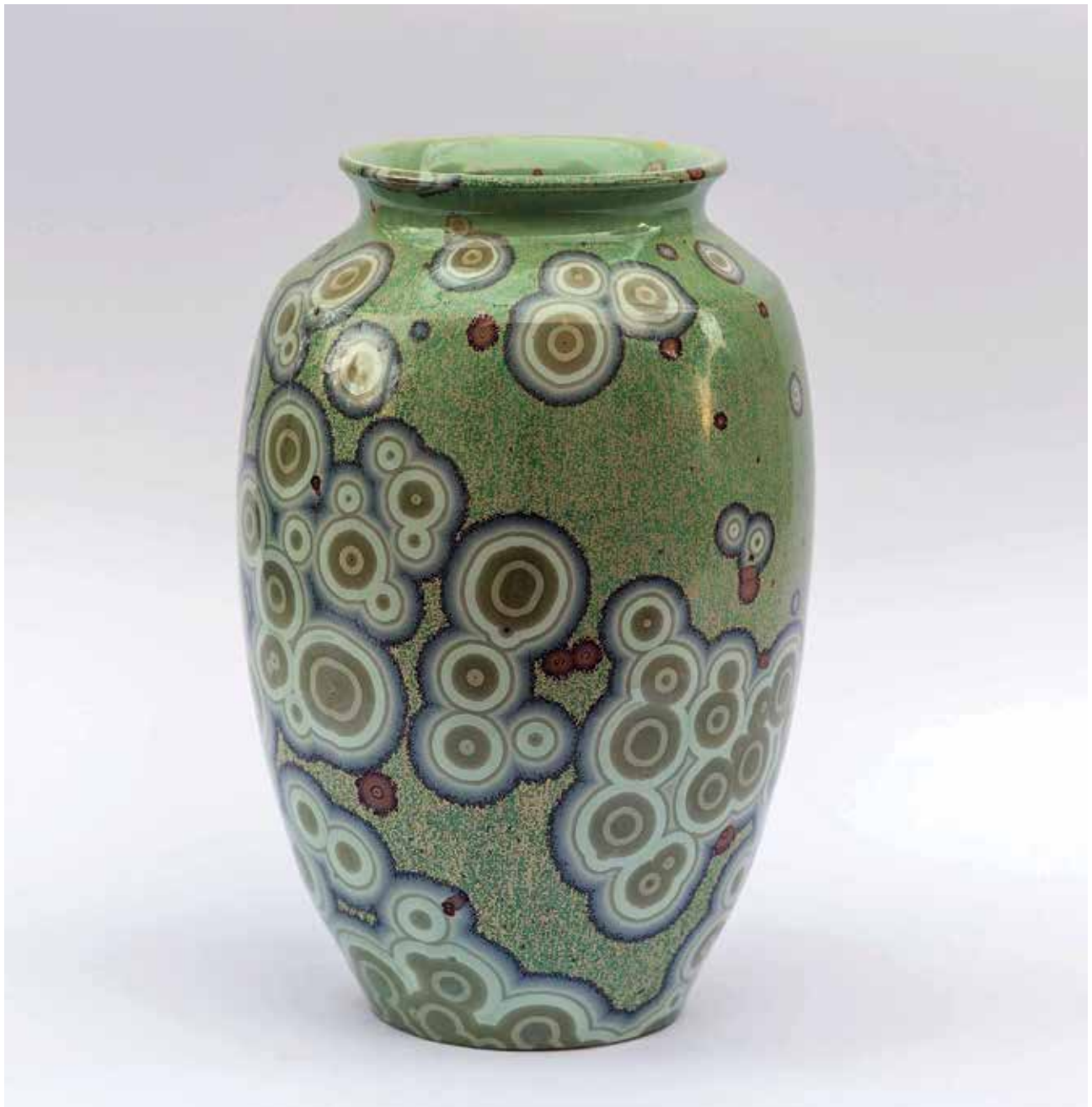
BARTHA István: Váza | István BARTHA: Vase | 2018, AB porcelán, korongozott, cink-oxidos kristálymáz, magasság: 24 cm