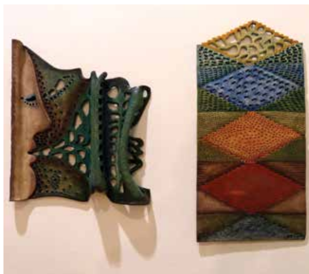
TÓVÖLGYI Katalin: Fuvallat (balra) és Lépcsők

Katalin TÓVÖLGYI: Whiff (left) and Stairs