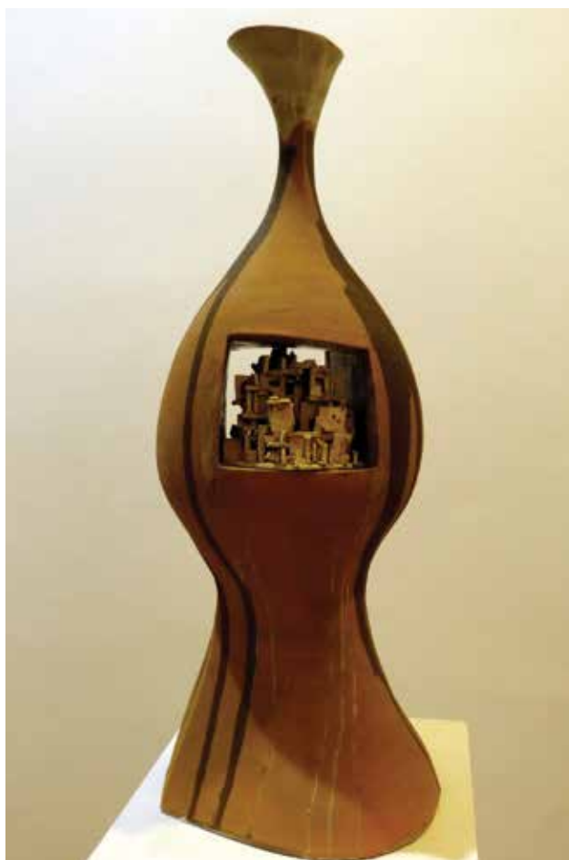
LŐRINCZ Győző: Vázatitok II. | Győző LŐRINCZ: Vase secret II 2018, kerámia, felrakott, mázazott, magasság: 82 cm

nyítja, hogy tehetsége jelentős munkabírással párosul. Izgalmasak Kis Virág edényei, különösen a Tollas készlet , amelynek darabjait sötétbarna matt felületen fényes, illetve fényes felületen matt tollakkal díszítette. Új technikát alkalmaz Horváth Lotti, aki betonba ágyazta porceláncsészéjét és foltos mázas tálgját.