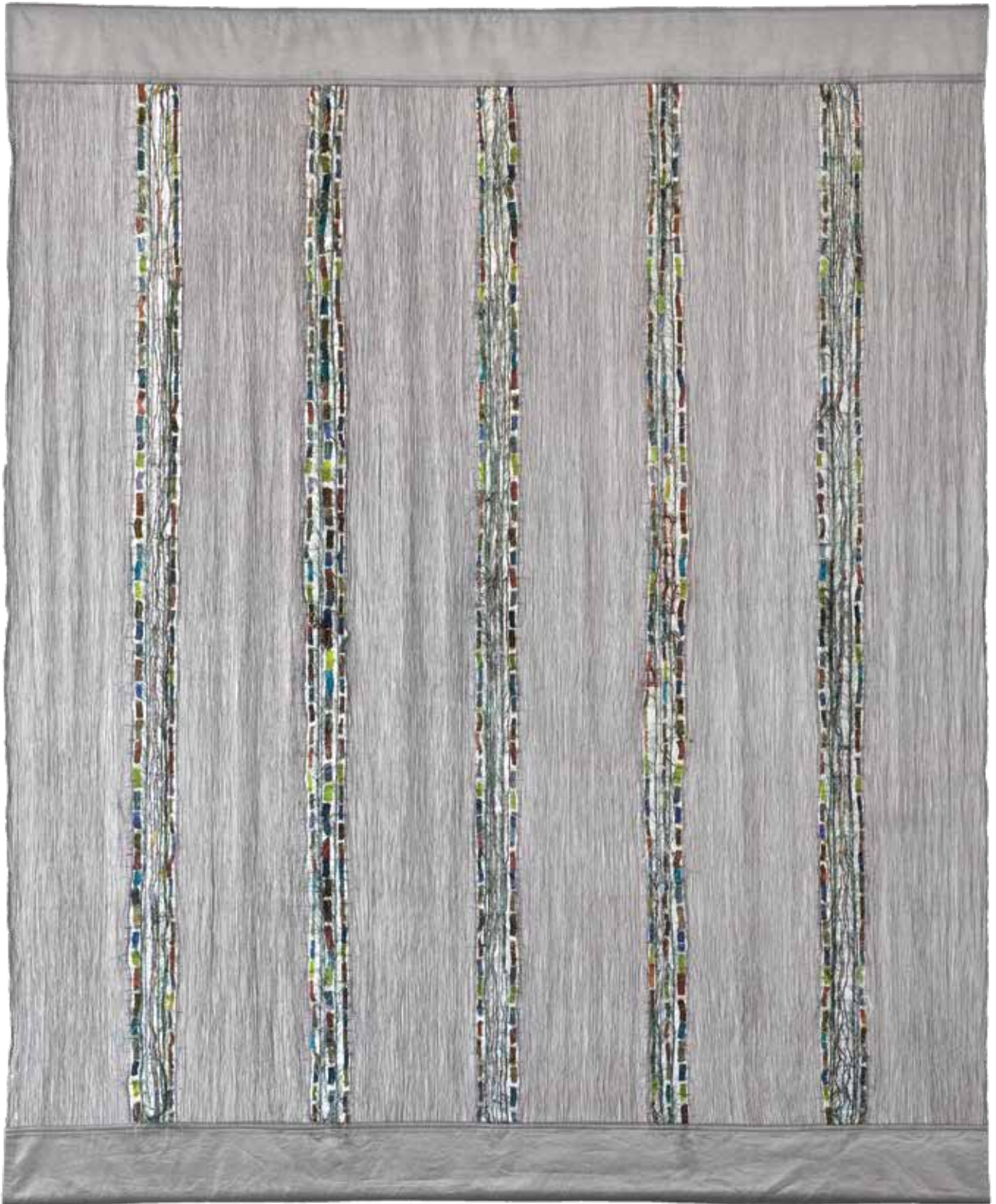
VERECZKEY Szilvia: Ezüst fű, autonóm textil | Szilvia VERECZKEY: Silver grass. Autonomous textile 2010, hernyóselyem-metál szövet, hernyóselyem santung, moherszálak, egyéni technika, kézi és gépi varrás, 210x200 cm