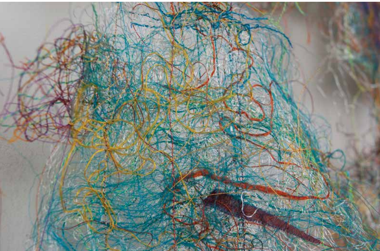
VERECZKEY Szilvia: Függőben, avagy finom elmozdulások, autonóm textil (részlet) | Szilvia VERECZKEY: Pending, or Subtle shifts. Autonomous textile (detail)