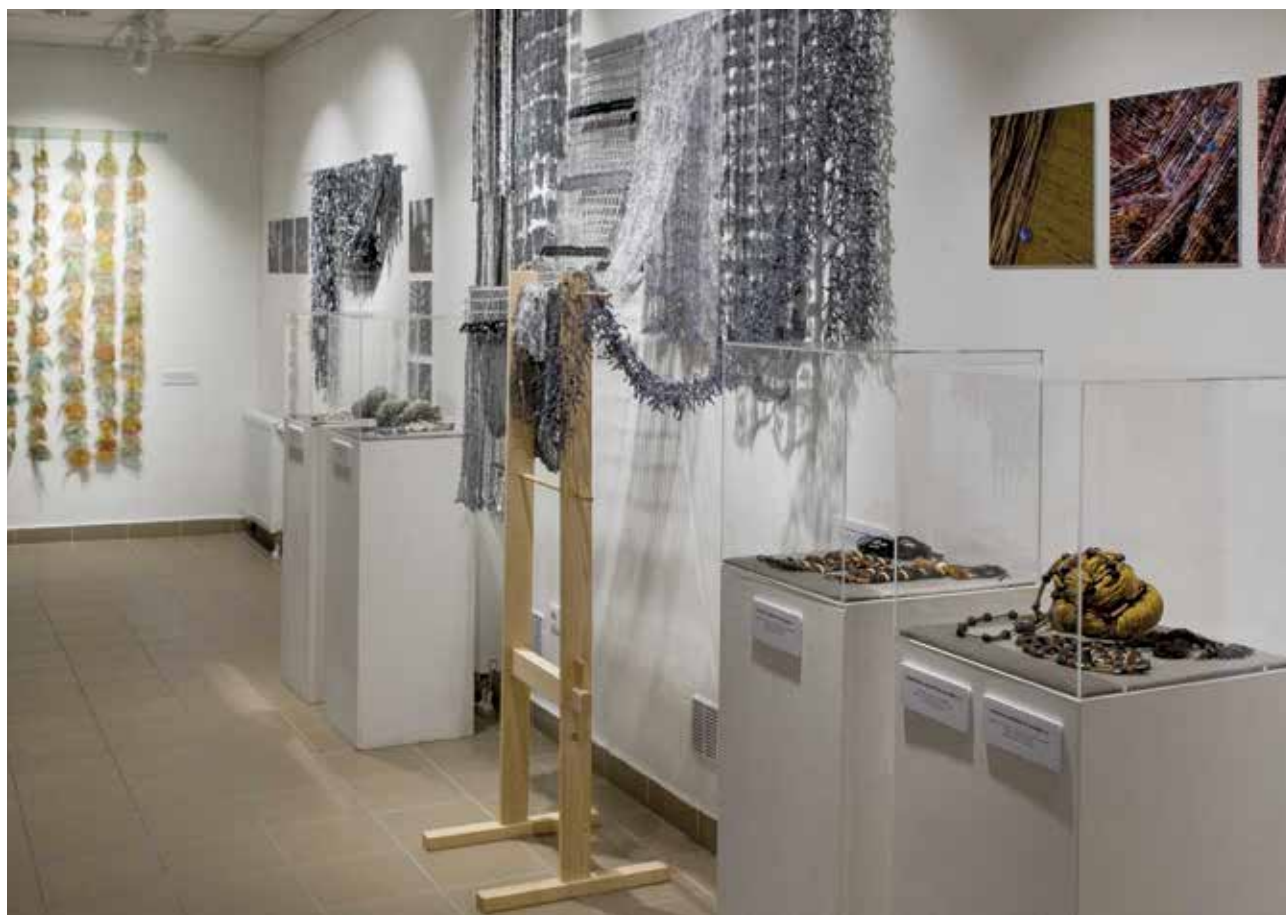
VERECZKEY Szilvia Frissek és szeretettek című kiállítása (részlet) | Szilvia VERECZKEY: 'Fresh and Loved Ones'. Exhibition view B32 Trezor Galéria, Budapest, 2018–2019