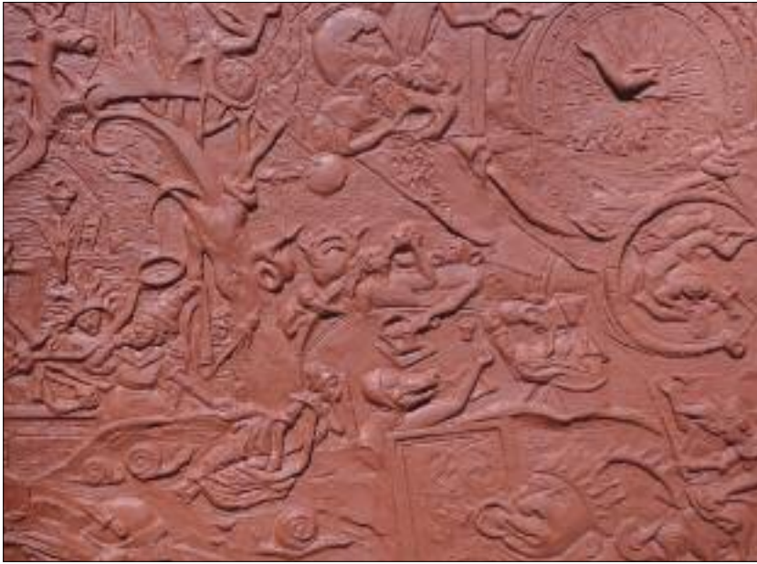
Szűcs Zsuzsanna: Onus septem – Hét teher, ami a lelket nyomasztja (részlet) / Zsuzsanna Szűcs: Onus Septem – Seven Burdens of the Soul (detail) 2018, vörös kőcserép, 1150 °C, a teljes méret: 42,5x45x2,5 cm

legmeglepőbb, a közönségét a művészeti élethez képest jóval szélesebb körben (is) kereső válasz Pittmann Zsófitól érkezett, akinek a cigány jóskártyák ábrázolásai alapján tervezett és előrajzolt sorozatát, A hét főbűnt (2011) a kalocsai börtönben fogva tartott nők hímezték ki hét IKEA konyharuhára.