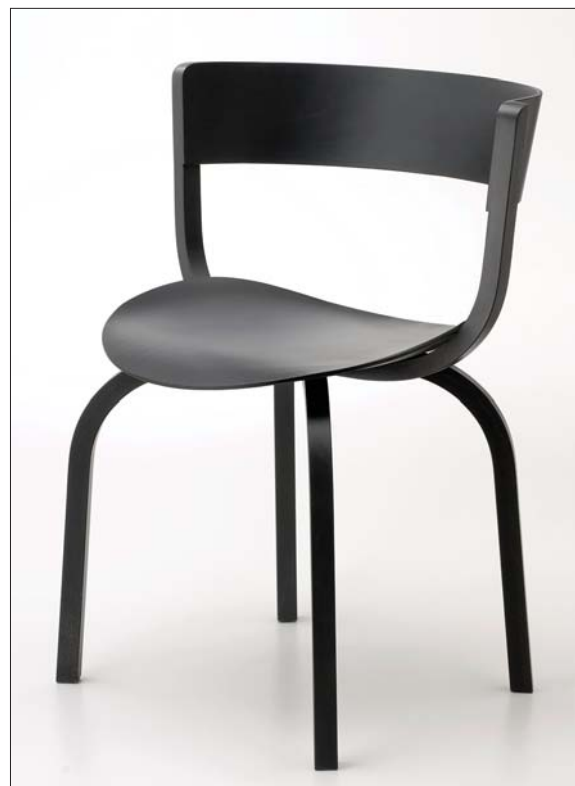
Stefan Diez: Houdini szék (e15) / Stefan Diez: 'Houdini' chair (e15) [2009]