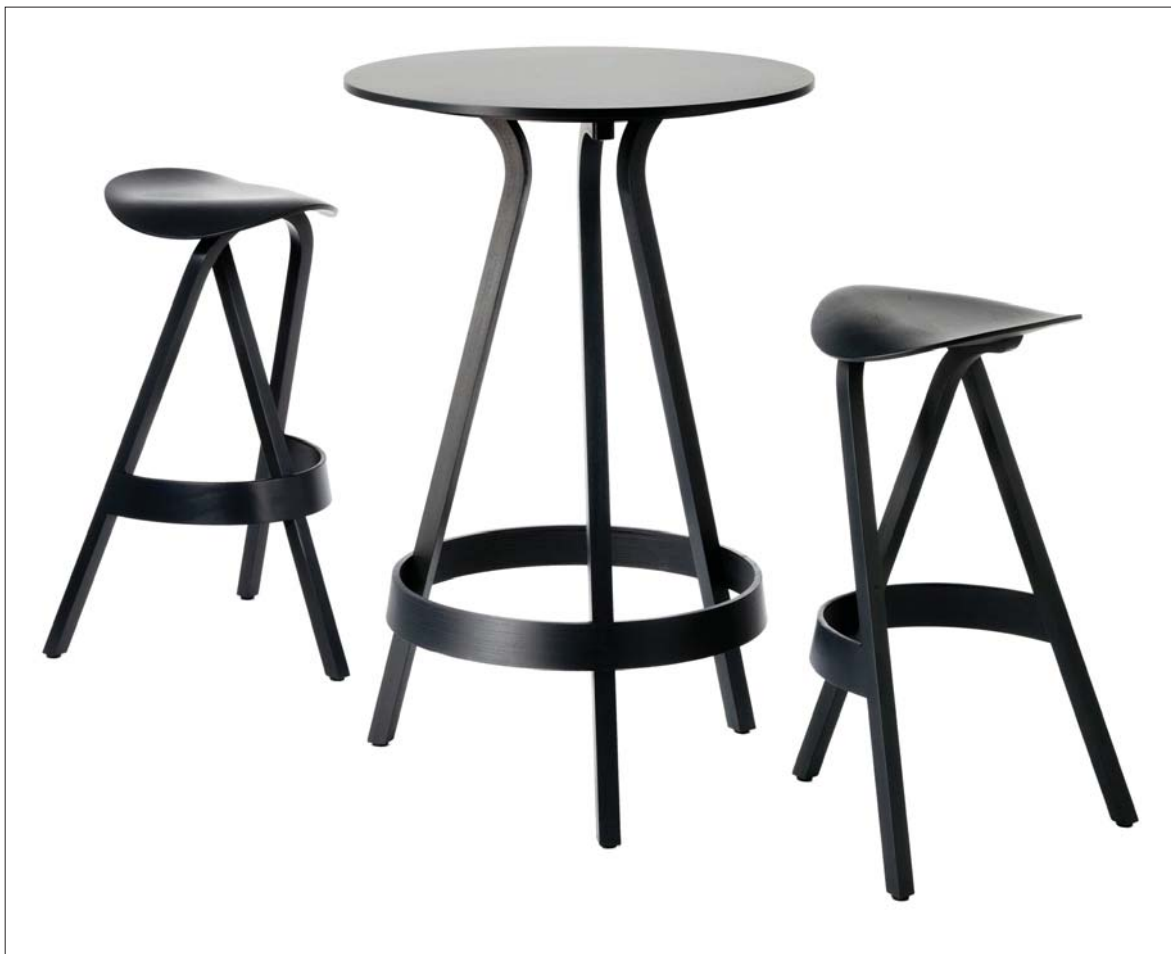
Stefan Diez: 404 H család (Thonet) / Stefan Diez: '404 H' family (Thonet) [2007]

mellett, a kiállítás bútorainak félkész – a kivitelezés folyamatát szemléltető – modelljei tanúskodnak. Igazán meggyőzők persze maguk a termékek: a papír anyagszerűségét érzékeltető táska (a Tyvek névre hallgató szintetikus anyagból), a lézerrel vágott színes alumíniumlapokból kézzel stancolt perforáció mentén hajtogatott ülőke, avagy a 25 részes porcelán edénykészlet, amelynek a Diez-stúdióban egyedileg mintázott gipszmodelljét a négyszáz éves múltra visszatekintő Itariban egy japán mester adaptálta sorozatgyártásra. Ugyancsak e sorba kívánkozik a magyar származású amerikai illuzionistáról elnevezett Houdini