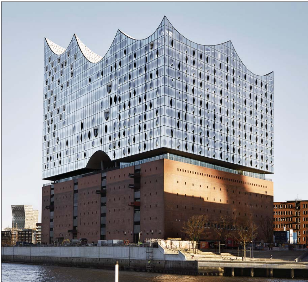
A hamburgi Elbphilharmonie. Terv: Herzog & de Meuron / The Elbphilharmonie concert hall in Hamburg, designed by Herzog & de Meuron

A világhírű svájci iroda, a Herzog & de Meuron tervezte épületben két hangversenyterem kapott helyet. Rámpás mozgólépcsőn megközelíthető impozáns kö-