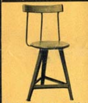
Támlásszék, 50 cm 10-