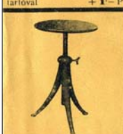
Zongoraszék, szabályozható, 45 cm-től 70 cm-ig 16- P