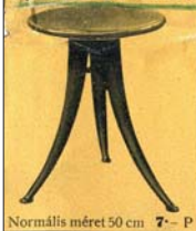
Normális méret 50 cm 7- P