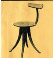
4 lábú támlás, 50 cm 11-50 P