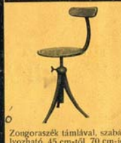
Zongoraszék támlával, szabályozható, 45 cm-től 70 cm-ig 19- P

KIRÁNDULÁSRA vegyen könyvszerűen összehajtható «WEEK-END» vasszéket. Akasztásukba elhelyezhető. Könnyű, erős, olcsó! P 3-