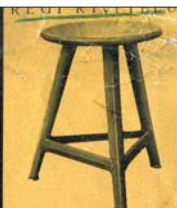
Normális méret 7- P