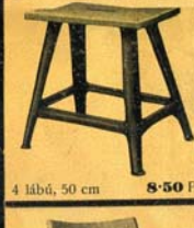
4 lábú, 50 cm 8-50 P