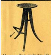
Magas székek kívánatra lábtartóval + 1- P