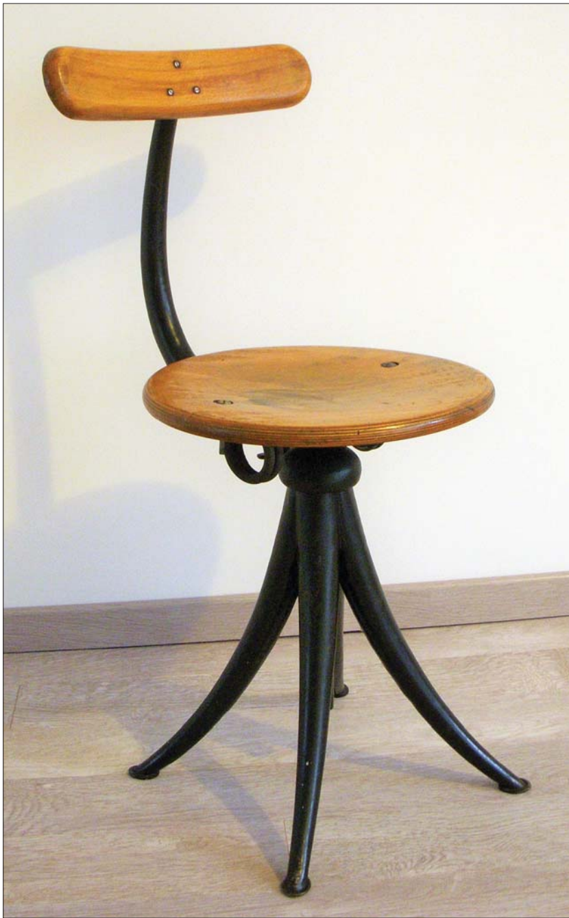
Fotó: Sándor Ákos

rólap, amelynek hátoldalán a „FIX” márkanév alatt forgalmazott acélszékek különféle típusai láthatóak. A háromlábú műhelyszéket – háttámlával vagy anélkül – tízféle méretben kínálták, de volt négylábú, állítható magasságú vagy épp lábtartóval kiegészített változat is. Ezeken túl, amint arra a szabadalmi leírás szövege is utal, az igény szerint variált szerkezeti elemekből további típusokat is összeállíthattak, hiszen a korábban említett, magántulajdonban fellelt négylábú szék nem szerepel a hirdetésen. A termelés kisipari kereteire utal ugyanakkor a szórólap méretekre vonatkozó megjegyzése: „Azok lehetőleg betartatnak, de azokért felelősséget nem vállalok.”