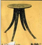
4 lábú, 50 cm 8-50 P