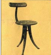
Támlásszék, 50 cm 10- P