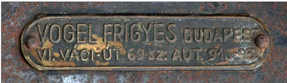
Préselt fémtábla a gyártó jelzésével a műhelyszék alján / Pressed metal plate with the sign of the manufacturer on the bottom of the workshop stool