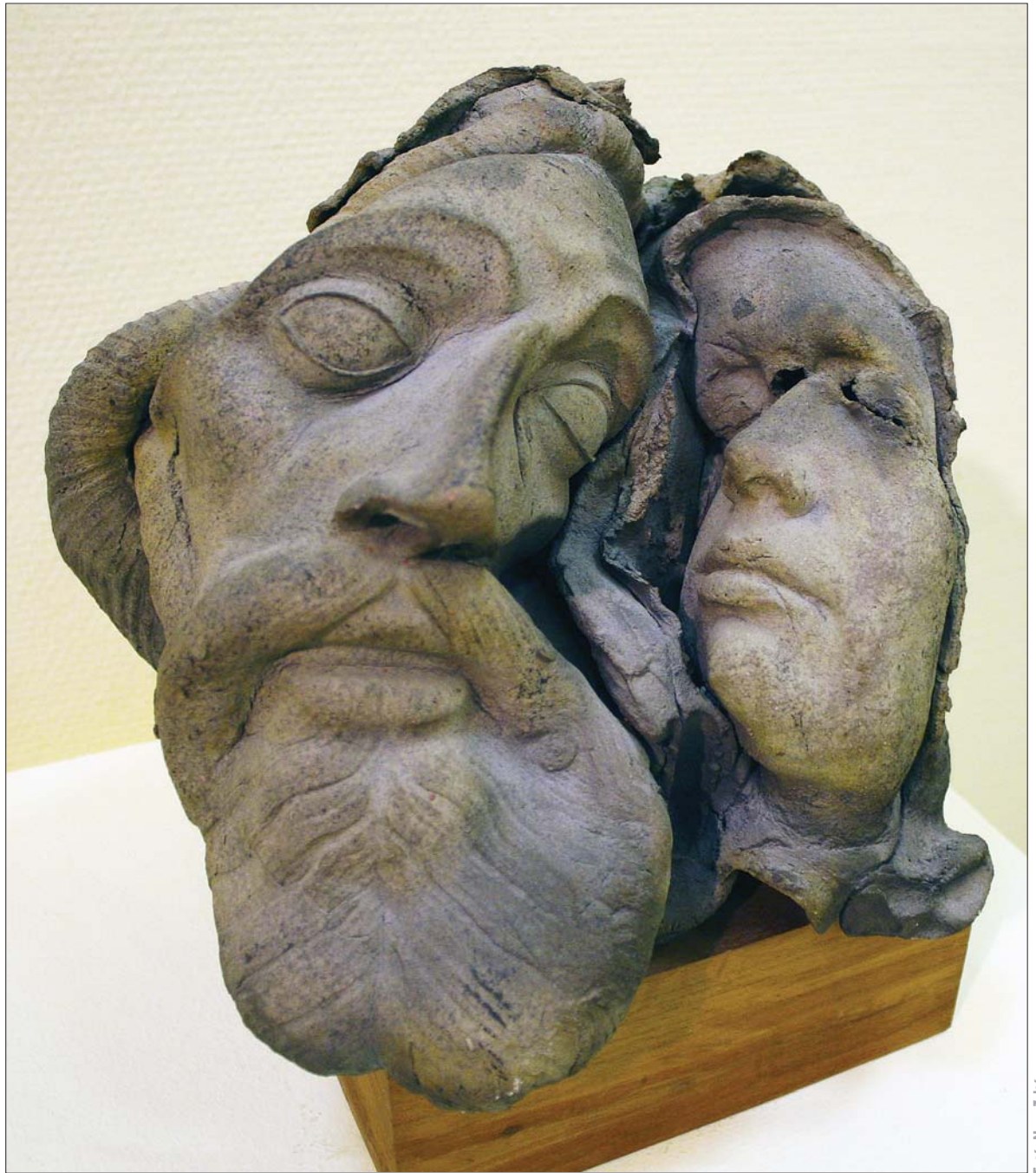
Schrammel Imre: Szerelmespár II. / Imre Schrammel: Lovers, II [1986] rakuzott kerámia / ceramics, raku [23x28x31 cm]