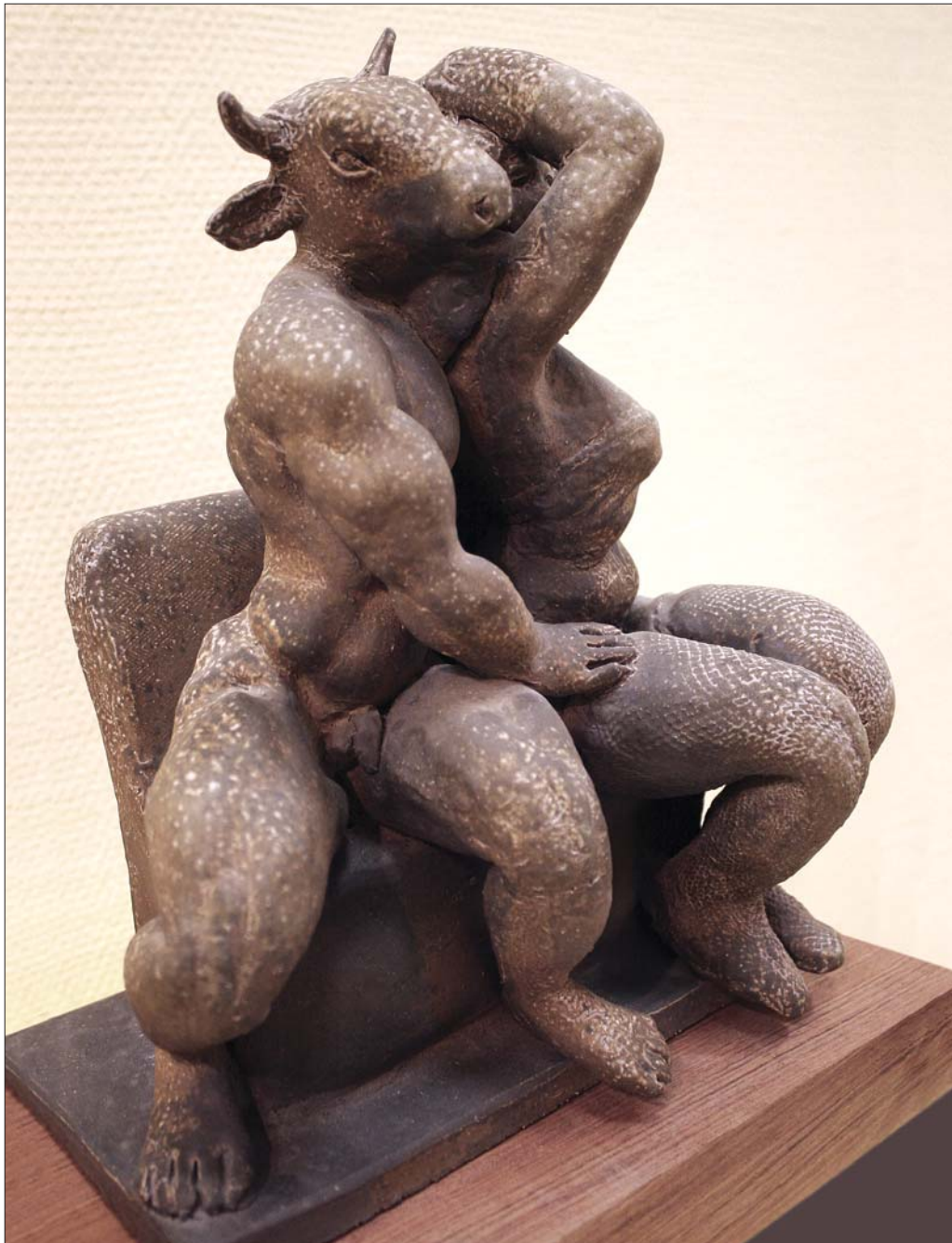
Schrammel Imre: Flört / Imre Schrammel: Flirt [2010] kőcserep / stoneware [30x23x13 cm]