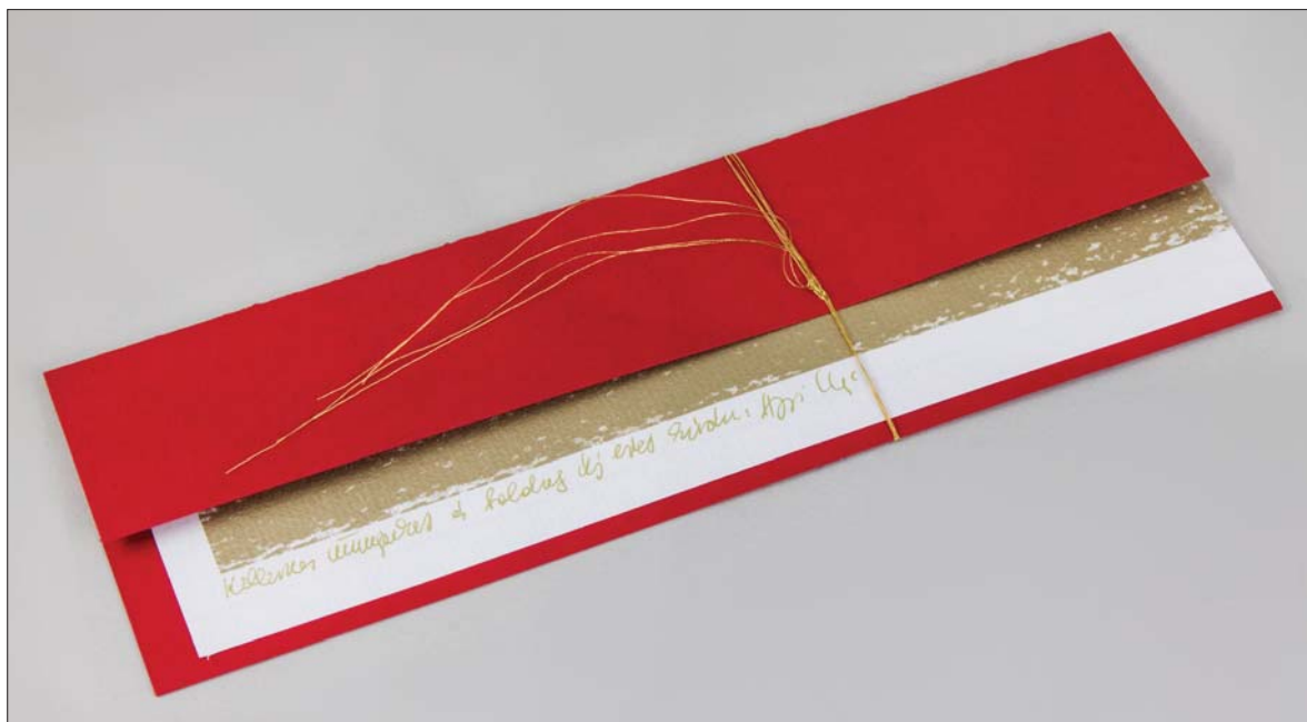
Hegyi Ibolya: Üdvözlőlap / Ibolya Hegyi: Greeting card [2013] papír, zselés toll, fémszál / paper, gel pen, metal thread [7x20,9 cm]