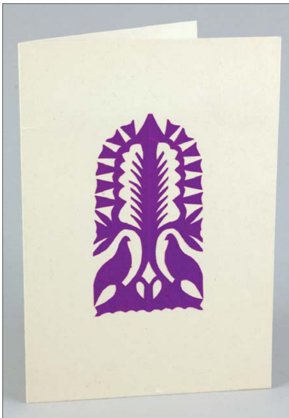
Zofia Szydlowska üdvözlőlapja / Greeting card from Zofia Szydlowska [1967] papír; kivágásos díszítés / paper; scallop [13,8x9,8 cm]

kalmasak az ünnepek megidézésére épp úgy, mint küldőjük révén közös élményeik felidézésére; megőrizhető üzenetek a múltból tárgyi, vizuális értékeik révén is. Így őrzök magam is néhányat közülük emlékezőként és művészi kvalitásuk alapján egyaránt; jó kézbe venni őket az ünnepek alkalmával.