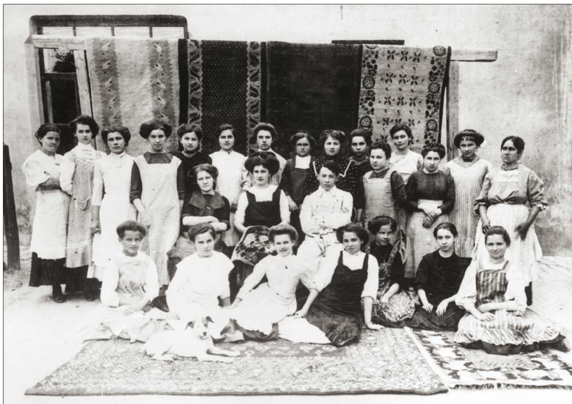
A kecskeméti szőnyegszövő munkatársai / Team of the carpet weaving studio of Kecskemét [1911] archív fotó (Kecskeméti Katona József Múzeum, Kecskemét) / archive photo (Katona József Museum of Kecskemét, Kecskemét)

Ahhoz, hogy részleteiben is megismerhessük Falus Elek itt töltött éveit, részesei lehessünk a korabeli, „újraépülő” Kecskemét miliójének, képzeletben „vág-