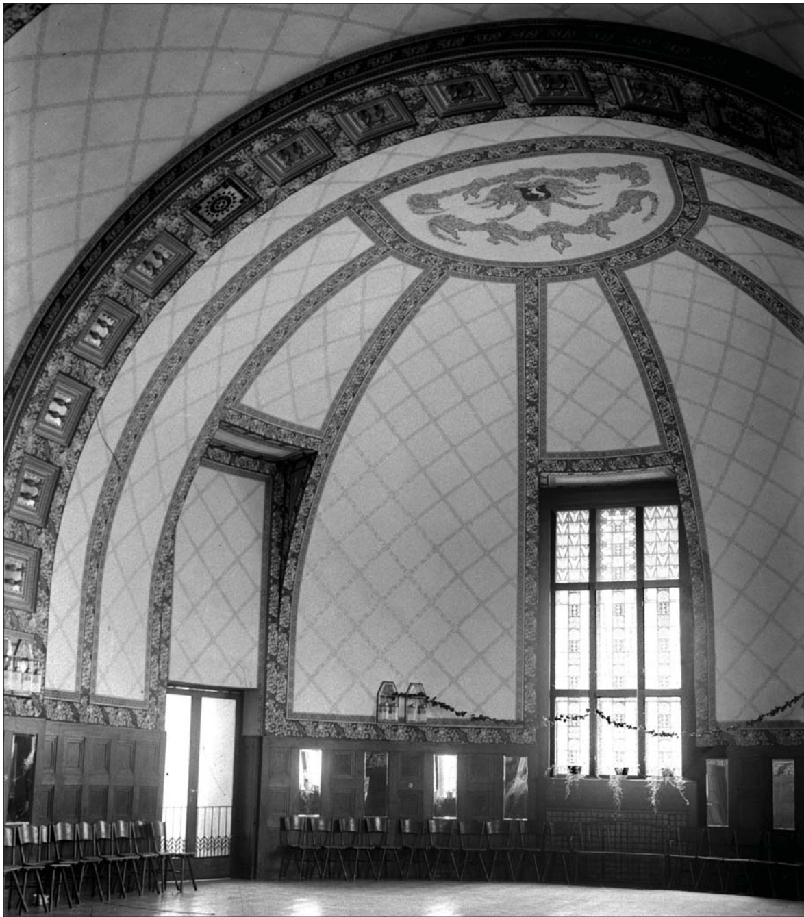
Az egykori Városi Kaszinó díszterme (részlet), Kecskemét / Ceremonial Hall of the contemporary Town Casino, Kecskemét (detail)

1930-as évek első fele, archív fotó, Bajtay Ferenc felvétele / first half of 1930s, archive photo by Ferenc Bajtay