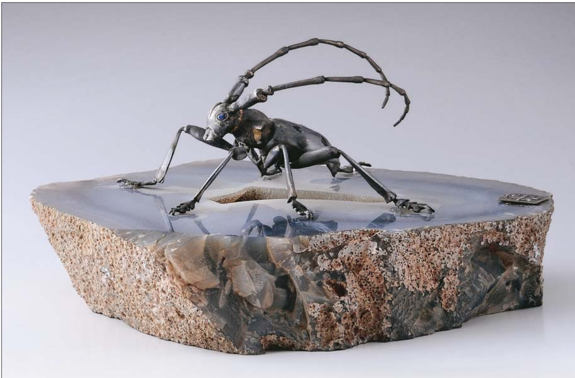
Péri József: Hőscincér / József Péri: Longhorn Beetle [1999] ezüst, achát, magasság: 10 cm / silver, agate, height: 10 cm

és zománcból megalkotott plasztikák nagyon jellemzőek a művészre.