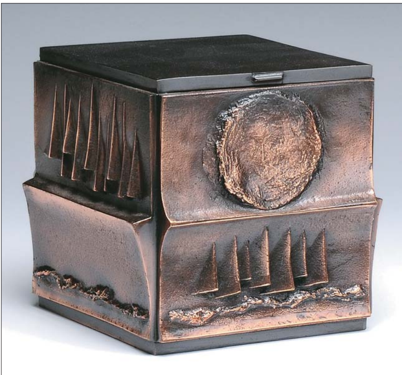
Fotó: Lénárt Attila

a technika alkalmazásának terén is. Öntött kisplasztikákat bronzból és vasból, reliefeket és plaketteket bronzból, készített fotómaratással díszített sárgaréz dobozokat, rézlemezből kalapált érmeket, vázákat és állatfigurákat, s már a nyolcvanas évektől dolgozott rozsdamentes acéllal. Vannak visszatérő témái, például a nagy, kerek sörényű oroszlanos reliefek, ahány példány, annyi királyi egyéniség. Dobozai, bronzplakettjei és domborművei máig gyakorta szerepelnek aukciókon, az internetes árveréseken többnyire „elkelt” megjegyzéssel. Ezüst ékszereit nyilván őrzik a