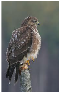
www.google.hu : Egerész-ölyv

Az egerészölyv hazánkban sík- és hegyvidéken egyaránt megtalálható ragadozó madár. Mint neve is árulkodik róla, előszeretettel vadászik egerekre és más rágcsálókra. Mivel táplálékforrása egész évben a rendelkezésére áll, hazánkban állandó madár, sőt állománya télen feldúsul a hozzánk északról érkező példányokkal. Az országos felmérések eredményei alapján az egerészölyv hazai állománya nem mutatott lényeges változást az elmúlt 10 évben. A korábbi, célzott táplálékvizsgálatok azt mutatják, hogy komoly gazdasági hasznot hajt, a rágcsálók fogyasztásával. Bővebben: http://www.foldegyesulet.hu/allatok/egereszolyv/egereszolyv.php