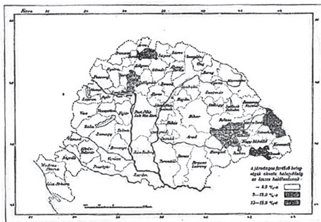
A ragadós betegségek együttes pusztulása hazánkban, nem számítva a tüdővérszt.