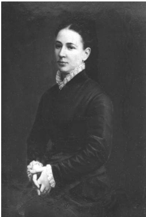
Kövály Endre: Bordó ruhás nő (Olaj, vászon, 38x28 cm, jelezve jobbra lenn: Kövály, Kolozsvár, magántulajdon)

Kövály Endre festményei legnagyobb számban érthetően saját felekezete, az unitárius egyház birtokában találhatóak föl. Kolozsváron a püspökség tanácstermében áll kiemelkedően szép alkotása: Kovács János (1846–1905) képmása. 33 A festő minden külsőség nélkül elevenítette meg az élénk tekintetű, szép, komoly, szakállas férfit, kinek arcára a fehér ingmell és gallér vetít világító fényt. Kövály igen jól ismerte képének modelljét, hiszen Kovács az unitárius kol-