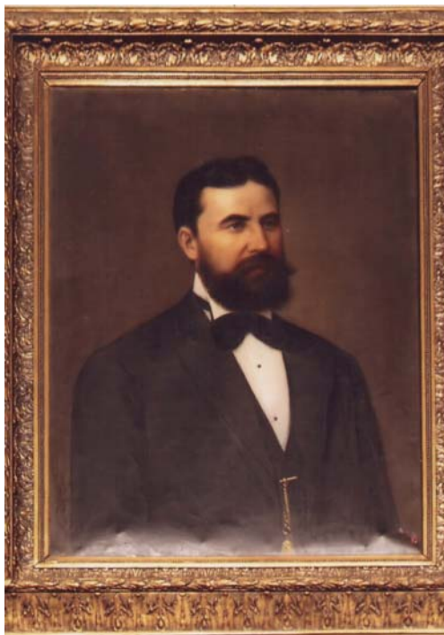
Kőváry Endre: Kovács János portréja (olaj, vászon, 75x59,5 cm, jelzés nélkül. A kolozsvári Unitárius Püspökség tulajdona. Ltsz. UP. 61.)

A festő legkorábbi ismert képmását a fényképész Marselek Ferencnek 1860 körül készült felvétele őrzi számunkra. Tipikus 19. századi alkatú, délceg, egyenes tartású férfi áll előttünk a régi fotográfián. Széles, magas homlokát dús haj keretezi, bajuszt és kis állszakállt visel. Öltözéke hosszú, gombos redingót és lábszárközépig érő csizma.