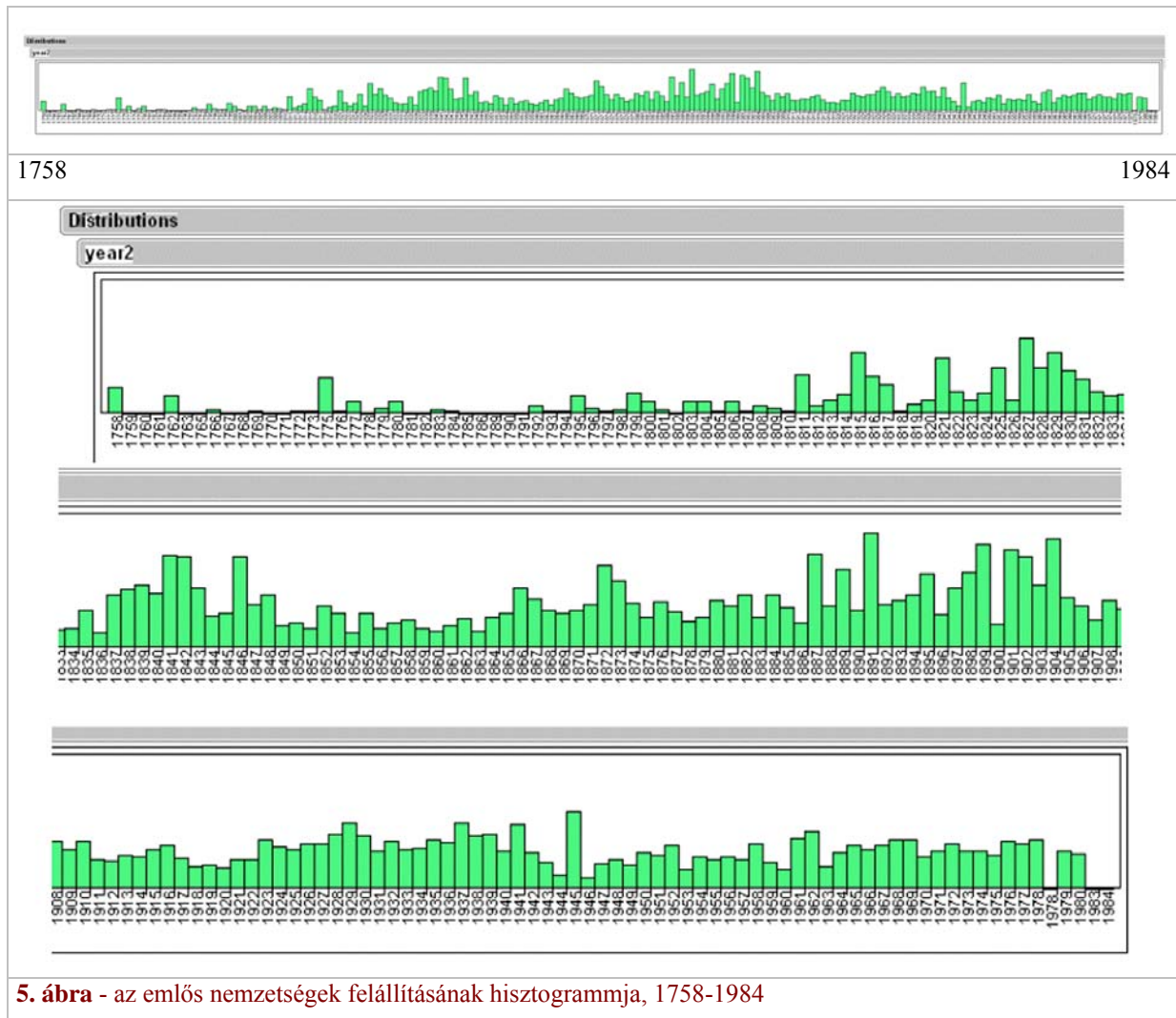
5. ábra - az emlős nemzetségek felállításának hisztogramja, 1758-1984

Be kell számítani az adatbázis hibáit. de a megfigyelt tendenciák - a nagy számok törvénye alapján - így is elfogadhatóak. Be kell számítani az adatbázis hibáit. de a megfigyelt tendenciák - a nagy számok törvénye alapján - így is elfogadhatóak.