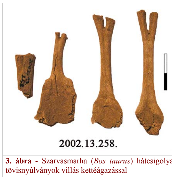
3. ábra - Szarvasmarha ( Bos taurus ) hátszigolya tövisnyúlványok villás kettéágazással

A lelőhelyről összesen 208 csontból állapítható meg, hogy fiatal korú egyedhez tartozhattak. Szarvasmarhából 166 fiatal korú egyed csontját sikerült meghatározni, s ebből legalább 3 egyedre lehet következtetni, kiskérődzőből 29 darab, s ebből legalább 2 egyed feltételezhető, házi sertésből 4 csont (2 állkapocs, karsont, lapocka) került elő, s ebből legalább 1 egyedre lehet következtetni.