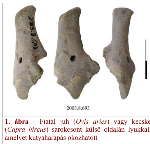
1. ábra - Fiatal juh ( Ovis aries ) vagy kecske ( Capra hircus ) sarokcsont külső oldalán lyukkal, amelyet kutyaharapás okozhatott

Vágásnyomokat 7 esetben lehetett megfigyelni: egy ló 2. ujjpercén, egy marha medencén, egy marha szarvcsapon, egy marha ujjpercen egy nagytestű patás medencén és nagytestű patás bordákon. Egy kiskérődző sarokcsonton ( 1. ábra ) valamint sípcsonton ( 2. ábra ) előfordult a csont megrágása. Elsősorban kutyák, esetleg sertések ejtenek a csontokon ilyen rágásnyomokat.