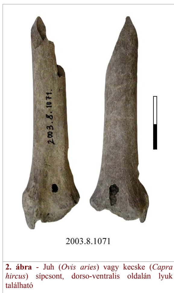
2. ábra - Juh ( Ovis aries ) vagy kecske ( Capra hircus ) sípcsont, dorso-ventralis oldalán lyuk található

Egy kiskérődző ágyékcsigolyának a szimmetria tengelye eltolódott, így lehetséges, hogy kórosan rendellenes. A lelőhelyről előkerültek megmunkált állatesontok is. ( 4. táblázat )