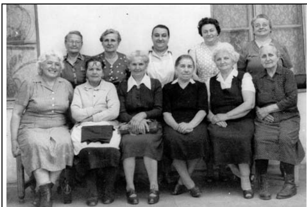
Csigázók a '60-as évekből