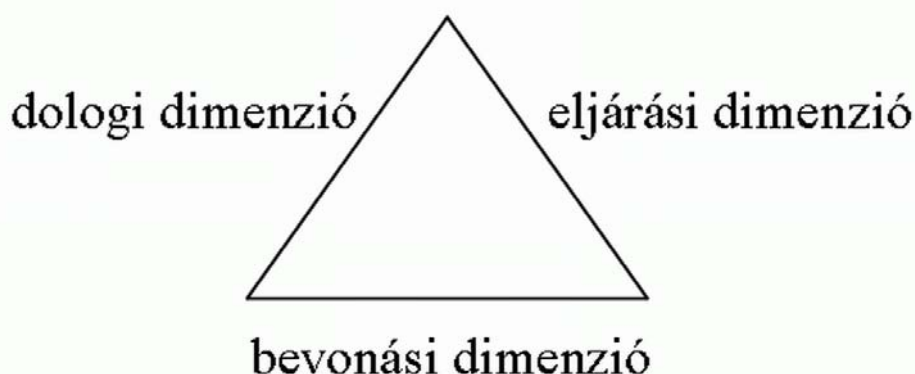
3. ábra: Az elégedettségi háromszög

ségszerűen ütközött a szociálpszichológiai és mediációs szakirodalomban elégedettségi háromszög nek nevezett jelenség korlátaiba. (Lásd a 3. ábrát.) Eszerint – leegyszerűsítve – az emberi szükségletkielégítés (szubjektíve mért) sikere nem kizárólag a megvalósult alternatíva materiális jellemzőin alapul (dologi dimenzió), hanem az érintettekkel folytatott kommunikáció minőségén (eljárási dimenzió) és bevonásuk mértékén (bevonási dimenzió) is; vagyis a szükségletek kielégítésének nem csupán objektív-materiális, hanem szubjektív-pszichológiai követelményei is vannak.