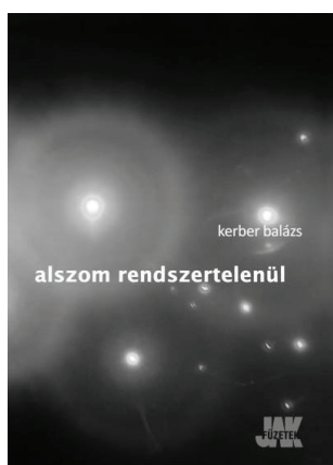
JAK+Prae.hu, Budapest, 2014. 122 oldal, 2000 Ft