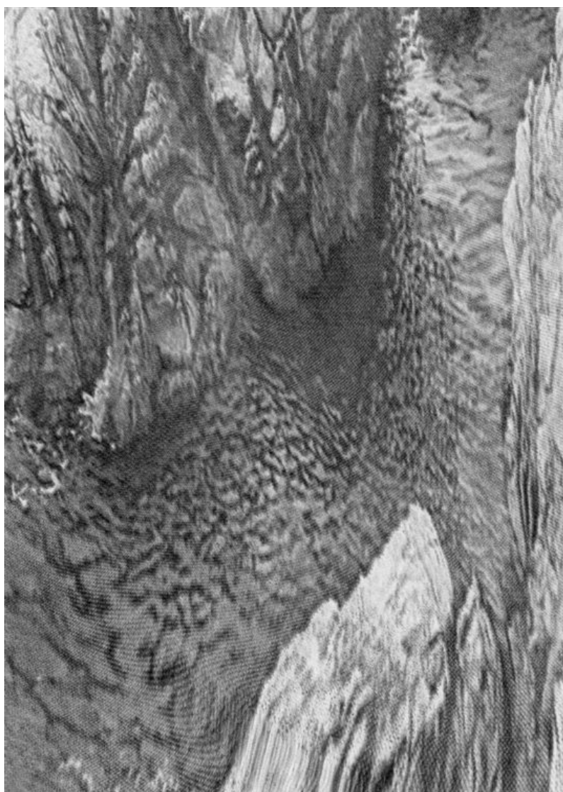
SÁNDOR EDIT: A FA MESÉJE