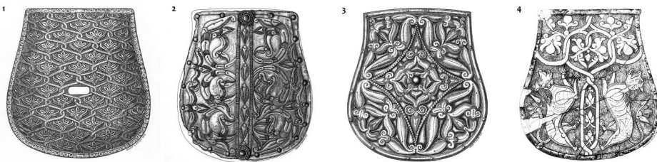
2. kép • 1. Bana (rekonstrukció); 2. Eperjeske; 3. Kecskemét-Fehéregyháza; 4. Veszeloovo

A banai tarsoly szerkezeti archaizmusával kapcsolatban Dienes az alábbi időrendi megjegyzést fűzte: „Épp kezdetleges felszerelési módja miatt a banai tarsolylemez egyik legkorábbi darabunknak kell tartanunk...” (Dienes, 1973, 207–208.) Ezzel a megállapítással ma is egyet kell értenünk, az újabb hazai és kelet-európai leletek tanúságai alapján is. Ebből pedig alighanem az is következik, hogy a tarsolyok fedelének lemezzel való borítása valóban a honfoglalás körüli időkre, talán a X. század elején válhatott élő gyakorlattá, ahogyan Dienes vélte. Ezt erősíti meg az a tény is, hogy a kelet-európai magyar szálláshelyeken sehol nem került még elő tarsolylemez. A bemutatott szesztovicai tarsoly azt példázza, hogy Csernyigov, Kijev, Szmolenszk és a Ladoga-tó környékén sincs egyelőre nyoma e lemezek használatának, s jelenleg úgy látszik, ott a tarsolydíszítés nem is jutott el erre a fokra. Mint láttuk, a skandináviai viking területeken is csak két lemezzel borított tarsoly ismeretes, mindkettő a birikai temetőből.