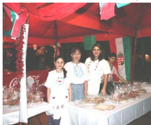
"Feria de los Migrantes. Asunción, Paraguay"

Les informo que el 12 de agosto hemos hecho entrega del aporte de nuestra Asociación para el festejo del día del niño en la Escuela República de Hungría.