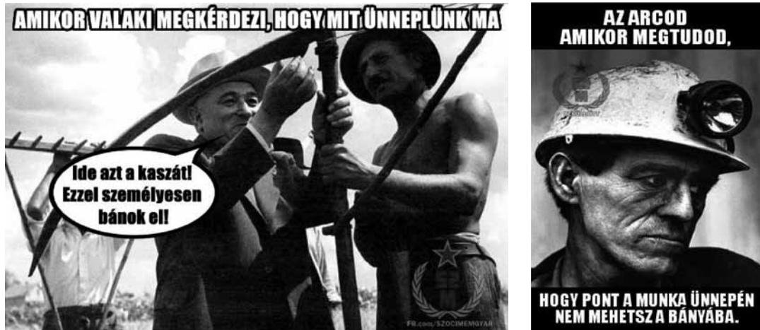
3. és 4. sz. ábra

A következő két mém (3., 4. sz. ábra) május 1-jén, tehát a munka ünnepén került megosztásra a Szocialista Mémgyár oldalán. Típusukat tekintve mindkettő „feliratos állókép”. Május 1. nemzetközi ünnep, amely több országban is általános szabadnap a mai napig. A szocialista pártállamokban az ünnep ideológiai céloknak volt alárendelve, és vajmi kevés köze volt a 19. századi angol munkásmozgalom eredményeiről való megemlékezéshez. 20