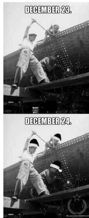
7. és 8. sz. ábra