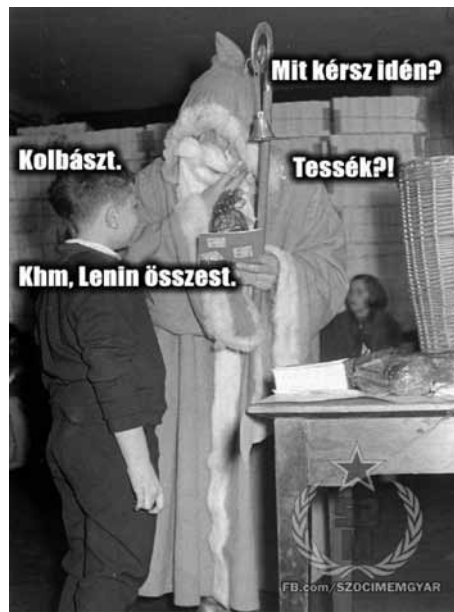
5. és 6. sz. ábra

A 6. sz. ábrán látható jelenet annak az igencsak „számottevő társadalmi vitának” egyik megalapozó kérdéskörébe tartozik, hogy a télen megjelenő és ajándékokat hozó, nagy és ősz szakállú öregember vajon a Mikulás, avagy a Téliapó. A jelenség a szocializmus kultúrpolitikájának és propagandatevékenységének azon ágába tartozik, amely próbálta lebontani, deszakralizálni és szekularizálni a rendkívül nagy társadalmi beágyazottsággal rendelkező vallási ünnepeket és hagyományokat. Magától értetődő volt, hogy a bolsevik ideológia adoptálásához hozzátartozott egynéhány szovjet-orosz kulturális elem átvétele. Ilyen volt a szovjet „Gyed Moroz” (Téliapó) előtérbe helyezése a Szent Miklós püspök alakját szimbolizáló Mikulás helyett. Abban természetesen nem volt különbség, hogy a két alak télen ajándékot hoz a gyerekeknek. A „feliratos állókép” típusú mém egy hagyományos párbeszédet jelenít meg, az ajándékot hozó Téliapó kérdést intéz az ajándékot váró gyer-