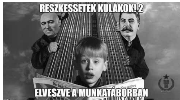
9. és 10. sz. ábra

A következő, a karácsonyi időszakban megosztásra került mém (9. sz. ábra) szintén az „áhitott” munkavégzés utáni sóvárgáshoz kapcsolódik. Azonban itt már a hatalom lehetőséget biztosít a proletariátus él munkásainak, hogy visszatérjenek a termeléshez, és ezt ők a startpisztoly elsütése után azon nyomban meg is akarják valósítani. Ez a „feliratos állókép” kategóriájú mém is a szocializmus emberének a munkavégzéshez fűződő elvárt viszonyát gúnyolja ki, továbbá reflektál a hatalom által elsúlytalanítani kívánt karácsonyi ünnepekör társadalomtól elvárt megítélésére. Így helyezve szembe a kor emberének ünnepi rutinját, a meghitt családi pihenést a mindennapos munka lélektelenül monoton egymásutániságával. Talán érdemes megemlíteni a képválasztással – valószínűleg nem tudatosan – összefüggő konnotatív jelentést: a képen megjelenő futóverseny ábrázolása a szocializmus