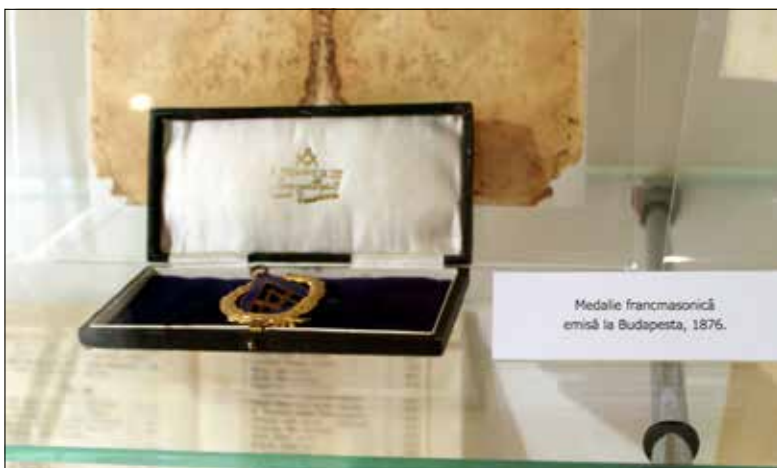
Budapesten 1876-ban készített szabadkőműves medál