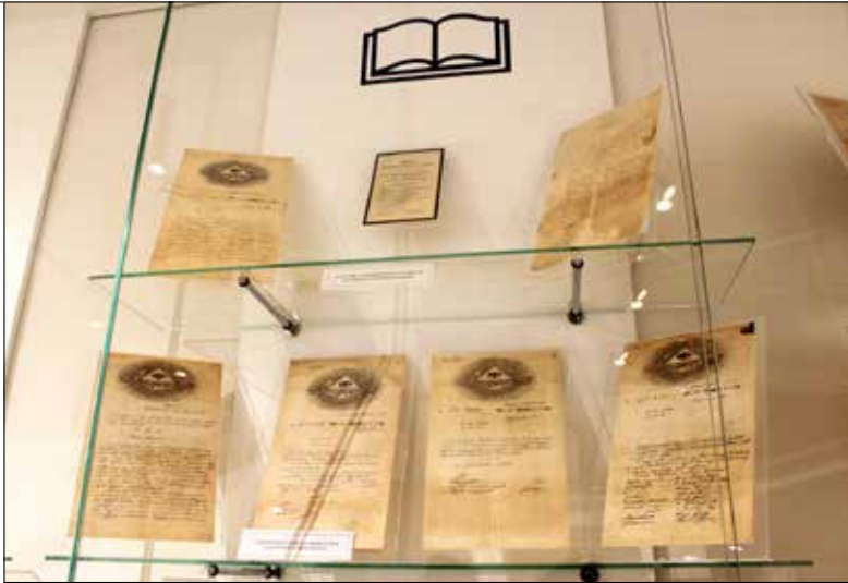
Megemlékezésére hívás és levelezés