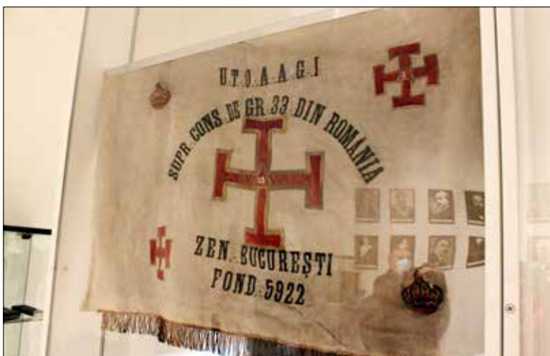
Az egyik zászló