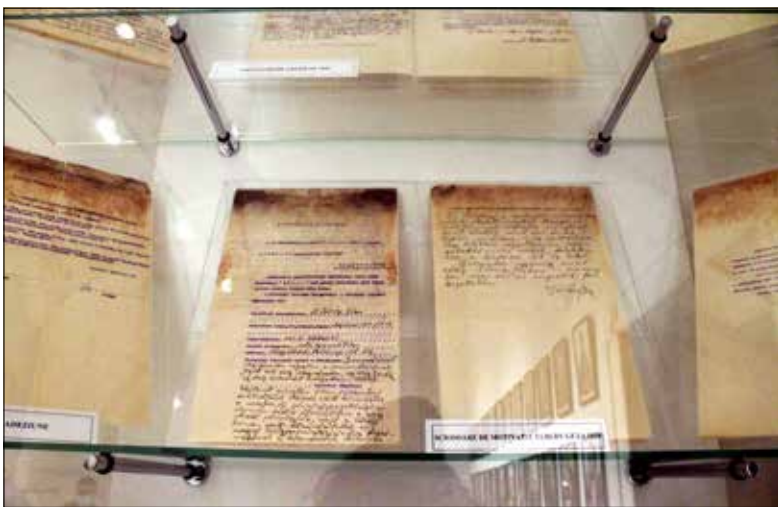
Tabéry Géza felvételi kérelme