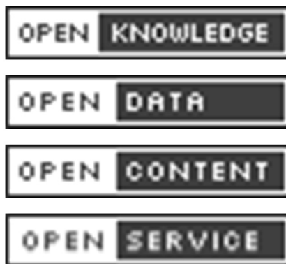
Az ikonoknak több (méretben és színben eltérő) verziója létezik.

Az Open Definition projekt által a nyíltság jelzésére kidolgozott ikonok a következők.