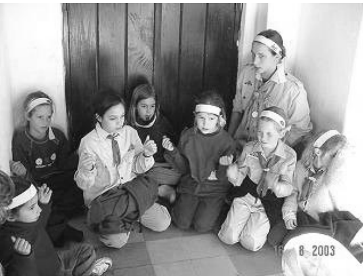
Fent, a kisgyerkészek egy csoportja, lent az öregcserkészek