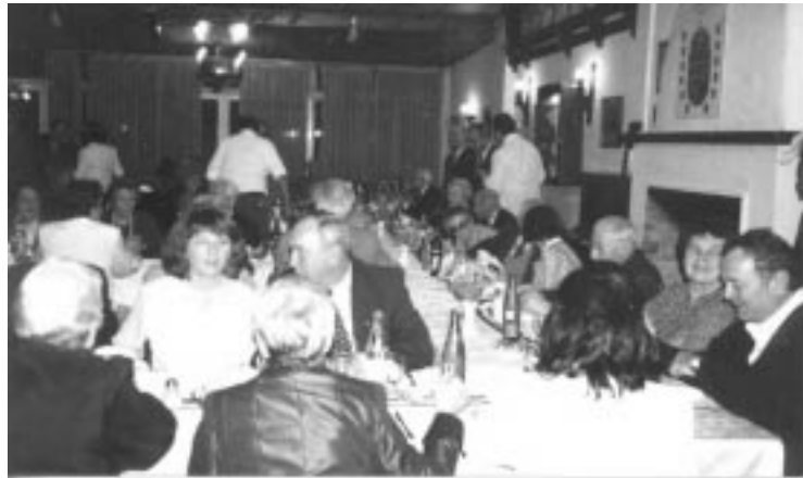
A Hungáriában augusztus 20-án megtartott fogadás résztvevőinek egy csoportja