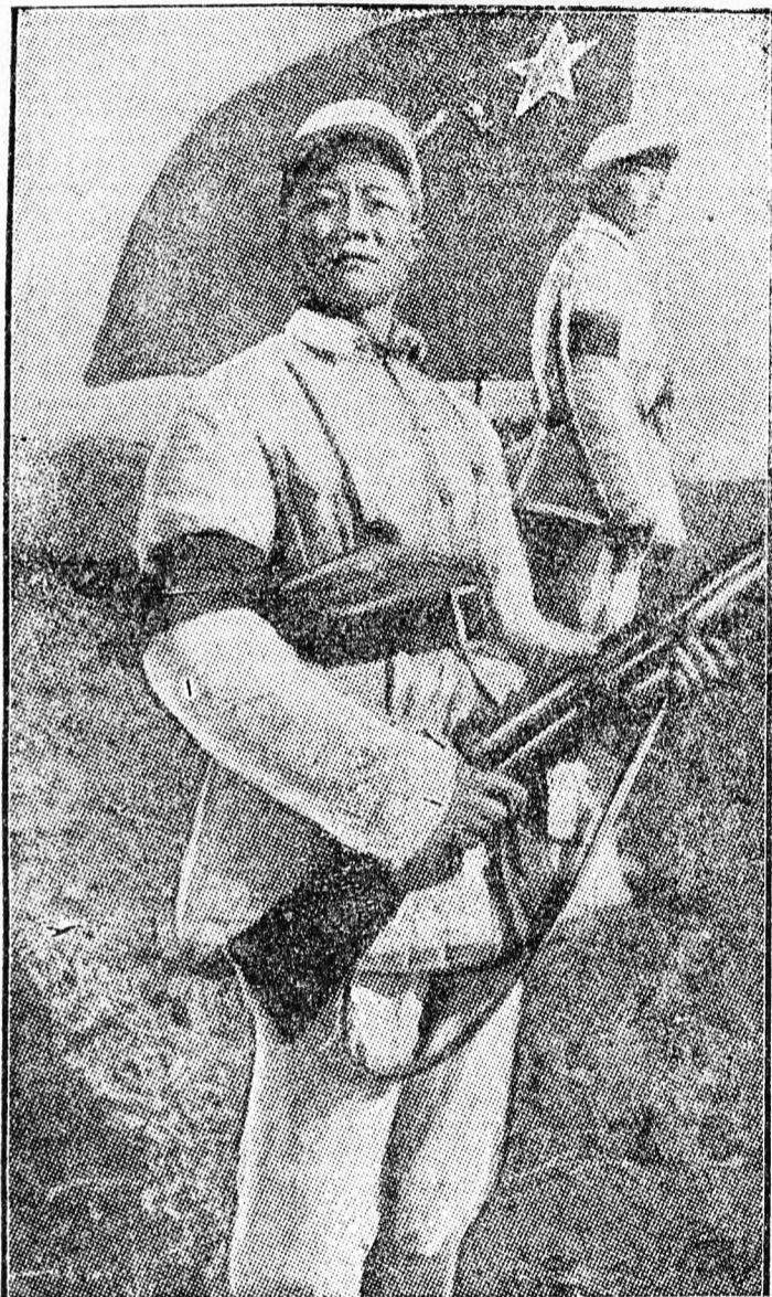
A hatalmas kínai nép hadseregének katonái bátran és elszántan védik a Kínai Népköztársaság határait, vigyáznak a nép szabadságára és biztonságára.

tanfolyamhallgató Götller Árpád örömeit. — A nyáron Nyíradonyban a Vörös Csillag TSZCS-ben például aratásban feleltek a versenyt a paraszti fiatalokkal. De előszörban a harc kiképzésben nagyszerű előmenetelről adnak bizonyosságot. Igaz, az üzem, a falu küldte va amennyit a fiúk. — hangsúlyozta a politikai tiszt.