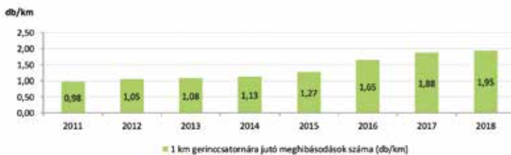
3. ábra: 1 km csatornavezetékre jutó meghibásodások számának alakulása 2011 és 2018 között

Hogy hová fog ez vezetni, az jó kérdés. Nem adjuk fel! Azt gondolom, előbb-utóbb át fogjuk szakítani a korlátokat, amelyek után akár gyorsan vagy akár lassabban is, de rendeződni fognak a nagy problémák. Nincs más út. A víziközműszolgáltatás nem megkerülhető, nem rendelkezik alternatívával. Orvoshoz el tudunk menni a szomszéd városba, de zuhanyozni vagy vécére a szomszédba sem megyünk!