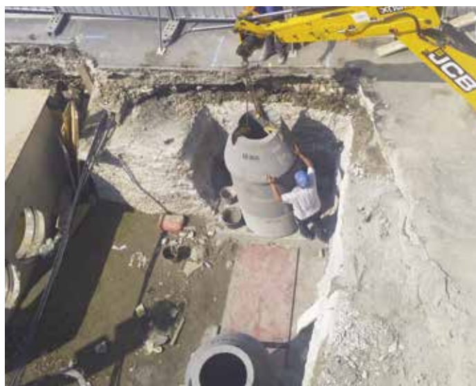
Közmű keresztesítés (TÁVHŐ vezeték, csapadékcatorna) Budapest, V. ker. Március 15. tér.

MB: Köszönöm a beszélgetést. Sok sikert és kitartást a feladatokhoz!