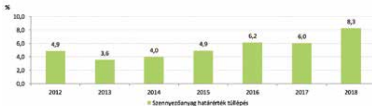
4. ábra: A szennyezőanyag-határérték túllépés aránya 2012 és 2018 között

MB: Ebben a folyamatosan romló és nem sok kilátással kecsegtető helyzetben nyilván a „hangulat”, az optimizmus is lanyhul. Ezek ellenére mennyire tud egységes maradni a MaVíz? Mennyire tudja a „magyar betegség” elkerülni?