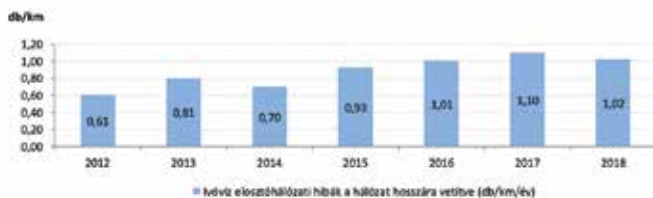
1. ábra: Az 1 km-re eső elosztóhálózati hibák számának alakulása 2012 és 2018 között

KV: Amikor ezt az időbeni változást szemléltetni szeretnénk, akkor legszívesebben mindig a hibastatisztikákhoz nyúlok, ahhoz, hogy az 1 km-re jutó meghibásodások aránya hogyan alakul mind a víz, mind a csatorna-szolgáltatás területén. Szintén fontos mutató a kifogásolt ivóvízminták aránya és a szennyezőanyag-határérték túllépések aránya. Ezekből a mutatókból és tendenciákból jól látszik, hogy a tennivalóink az idő előrehaladtával szaporodnak és szaporodni is fognak.