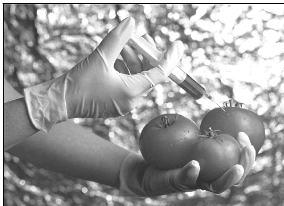
2. ábra: Ausztriában a genetikailag módosított élőlényekkel kapcsolatos tipikus képi ábrázolás

Középpontba a megküzdés fogalmát helyezik, ami nem hiányzik a szociális reprezentáció elméletéből sem, hiszen az ismeretlen megszelídítése Moscovici eredeti elképzelései szerint is központi motívuma a közösség reprezentációs törekvéseinek. A pszichológiában általánosan használt megküzdés fogalmával való rokonságot annyiban megerősítik, hogy az általuk leírt kollektív forma is többé-kevésbé tudatalan, nem kontrollált folyamatokat igyekszik megragadni, még ha tartalmaz is megismerési összetevőt. Természetesen a kollektív megküzdésben is alkotó részt vállalnak az egyéni törekvések, nem kizárólag az individuum feje fölött zajlanak ezek a folyamatok sem. Hangsúlyozzák azonban a média szerepét, amely a szenzációt keresve az újat figyelemre méltónak, a szokásokkal, a meglévő helyzettel szemben kihívást jelentőnek állítja be.