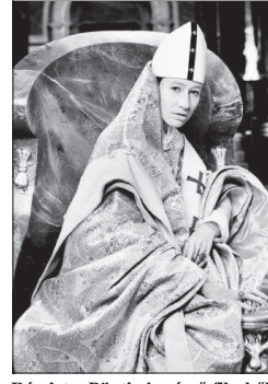
Részlet a Páptissin című filmből

Miért ítélték a történelmekutatók legendának a nőpapa történetét? Először is, mert a történet két eltérő változatban maradt ránk. Az első egy Jean de Mailly nevű domonkos szerzetestől származik, a 13. századból. Mailly úgy hallotta, hogy 1100 körül élt egy okos nő, aki férfiruhába öltözött, majd szerzetesként a Római Kúriába került. Ott előbb jegyző, majd bíboros, végül pápa lett. Egy lovaglás alkalmával fiút szült. A felbőszült nép erre a ló farkához kötötte, majd megkövezte és holttestét elföldelte. A második változat a lengyel származású Martin von Troppau (†1278) krónikájából ismeretes. E szerint IV. Leó pápa (847–855) után az angol származású Mainzi János uralkodott pápáként „két évig, hét hónapig és négy napig”. Majd így folytatja szövege: „Azt mondják, nő volt. Fiatal korában szeretője férfiruhába rejtette, Athénbe vitte, ahol nagy tudásra tett szert, ezért Rómába hívták tanítani. Ott olyan nagy megbecsülésnek örvendett, hogy IV. Leó pápa halála után pápává választották. Egy idő után terhes lett, és a Szent Péter valamint a Laterán között, amely akkor a pápa rezidenciája volt, fiút szült. Szülés közben meghalt, és a tett-helyen eltemették. Női mivolta, valamint alantas tette miatt nem vették be a szent pápák sorába.”