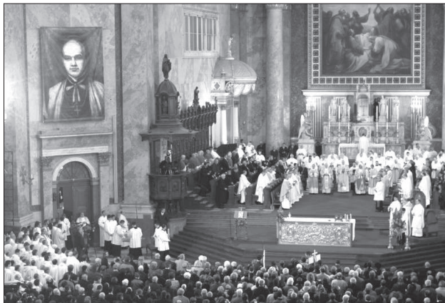
Meszlényi Zoltán vértanú püspök boldoggáavatási szentmiséje az esztergomi bazilikában