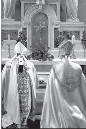
A boldog ereklyéje a bazilika mellékoltárájánál

Meszlényi Zoltán vértanú püspök élete a Szentlélek által megerősített keresztény ember tanúságtételének példája – mondta Erdő Péter, majd beszédének további részében felidézte az új boldog életének állomásait és gondolatait, amelyek az Egyházhoz, a Szentatyához való hűséget, állhatatosságát tükrözik. Rámutatott: tanítása ma is megrendítően aktu-