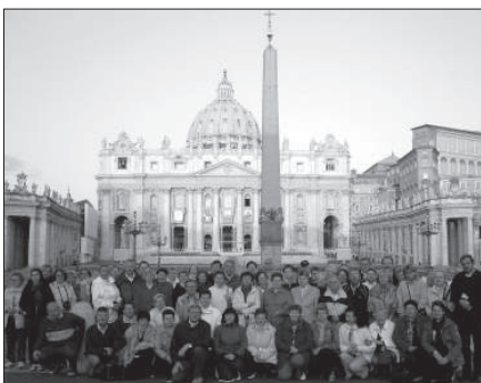
Magyar zarándokok a Szent Péter téren