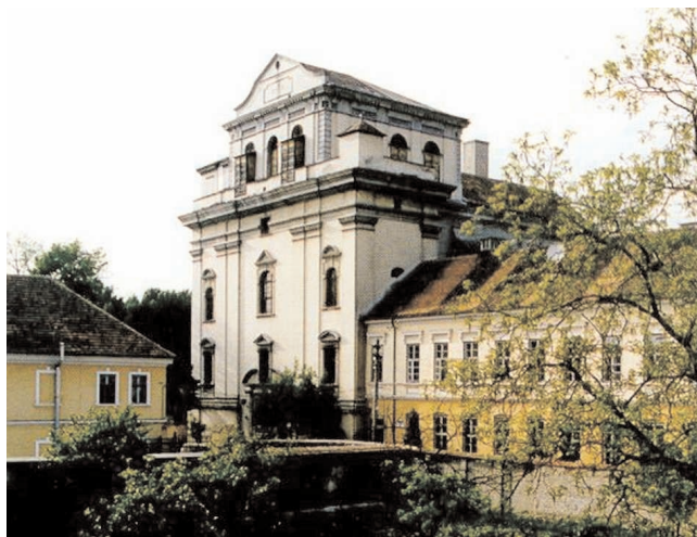
A Battyaneum és a „Teológia”, Gyulafehérvár

1969-ben Márton Áron püspök szentelte pappá Gyulafehérváron. 1969-1970 között szatmári püspöki titkár. Ezt követően (1974-1993) a Gyulafehérvári Hittudományi Főiskolán tanított szentírás-tudományt. 1990-1994 között gyulafehérvári segédpüspök, 1994-től gyulafehérvári érsek. 1991 óta az örömegek apostoli kormányzója is. 1990-ben Csíksomlyón szentelték püspökké. MK