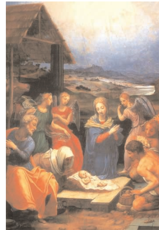
A pásztorok hódolata, Agnolo Bronzino, 1530, Szépművészeti Múzeum, Budapest