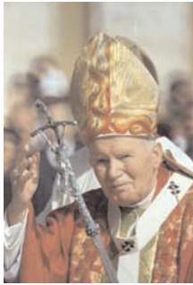
II. János Pál pápa

Pápasága kezdetétől fogva gondolatait, imáit, cselekedeteit egyetlen vágy vezérel-