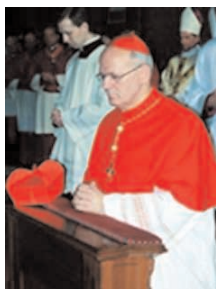
Erdő Péter bíboros

Erdő Péter esztergom-budapesti érsek, Magyarország prímása hatgyermekes értelmiségi családban, 1952. június 25-én látta meg a napvilágot Budapesten. Középfelsőiskolai tanulmányait a budapesti Piarista Gimnáziumban végezte. Egy évig az esztergomi Érseki Papnevelő Intézetben, majd a budapesti Közpon-