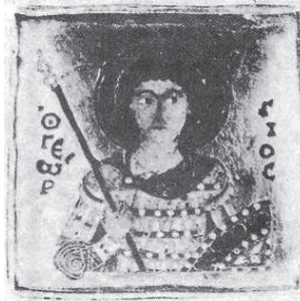
A Szent Korona Szent György-képe

Az esztendő negyedik hónapját, melyben rend szerint a húsvétot ünnepeljük, régi magyar kalendáriumaink Szent György havának nevezik. A keresztény ókor vitéz vértanúja megszemélyesíti a kikelet tavasi hónapjában a Világosságnak a Sötétség fölötti győzelmét, az isteni Jóságnak a Gonoszszágon aratott diadalát. Ennek a hősi győzelemnek