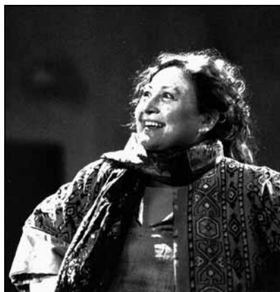
Howard Barker: Jelenetek egy kivégzésből

Mióta tudom, hogy vannak férfiak, nők, akiket színésznek neveznek, mindig az szerettem volna lenni. A felnőttek szemében – akik körülvettek egy kis faluban – ez kivihetetlen álmképnek tűnt. Aztán – mit tesz Isten! –, amit az ember belül nagyon elhatároz, az előbb-utóbb kifelé is megmutatkozik – tartja a mondás: az általános iskola és a nem éppen „humán” közgazdasági technikum után első nekifutásra felvettek a Színművészeti Főiskolára, sikeresen elvégeztem immáron negyvenhat éve, és azóta szolgálom Tháliát több-kevesebb, de inkább több, mint kevesebb sikerrel. Azok közé tartozom,