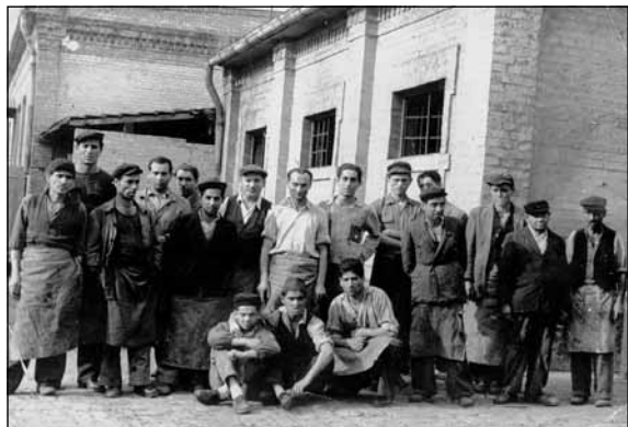
Újpesti szegkovács brigád, 1950

Kettévált a szövetkezet: egyik fele a Fóti útra, a tanácstól kapott telephelyre költözött, a másik fele pedig a rákospalotai cigánytelep mellett, az Aporhá-