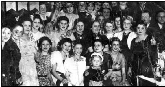
Cigánybál, Kör kávéház, 1939

talán darudübörgetősnek néz-te volna, amit jártak, de az emlékezőnek az éltes némberek szertelensége maradt felejthetetlen. A senki másnak, csak maguknak, még egyszer, hogy kamukore szeretem az uramat , de az is jaj de nagyon régen volt! Én szültelek e világra, én szoptattalak mindőtöket, tessék, innen jöttetek ki, ezen lógtatok!"