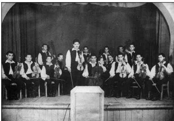
Újpesti Rajkó Zenekar, 1956

A cigánybálnak 47 több feladata volt. Az első és legfontosabb, hogy a szórakoztatásból élő zenészek most ez alkalommal, családjukkal együtt mulatni tudjanak. A másik a fiatal lányok első bálozóként való bemutatása a közösségnek. Az eladósorban lévő lányok minél jobb kiházasítása. (A jó muzsikussá váló partnernek számított, hisz valószínű el tudja tartani leendő családját. A rafináltabb anyósok itt figyelték ki, hogy a kiválasztott ifjú mennyire szereti az alkoholt, vagy hogy milyen illedelmes a szüleivel és a társasággal.) A bál egyik legfontosabb kitétele a lehető legrangosabb muzsikussá felfogadása, hisz az első kérdés, hogy ki muzsikálja a bált. Ehhez kapcsolódik az a szokás, hogy a fiatal muzsikuskoknak itt adatott meg az a