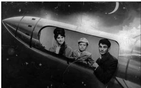
A Horváth család

Az 1994–1998-as választási ciklusban Újpest Önkormányzatának testü-