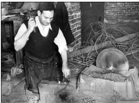
Gödörben dolgozó szegkovács

A letelepült szegkovácsok mobilitása a vasútépítő kubikusokéhoz volt hasonló. Szerszámaik elfértek egy talicskában: üllő, fújtató, fogók stb. Mint a vándoriparnál, gyakorlatilag bárhol felállították műhelyüket. A gyerekek a fújtatásban, a nyersanyag adogatásában, feleségük a késztermék rendezésében, számolásában segítettek. A fújtatás mellett a koksztörés volt az ifjak legfontosabb munkája. A megfogott darabot kalapáccsal úgy kellett eltalálni, hogy az ütés az ökölbe szorított kéz – a hüvelyk- és mutatóujj között képződött – résén csattanjon. Így nem repültek szerteszéjjel a jól égő por és koksztarabkák. Gyakorlat kellett hozzá, hogy az ujjakat és körmeiket szét ne verjék a gyerekek. Ha kevés volt a munka – nem volt szezonja –, a szegkovácsok zöldséggel, gyümölccsel kereskedtek. Arra