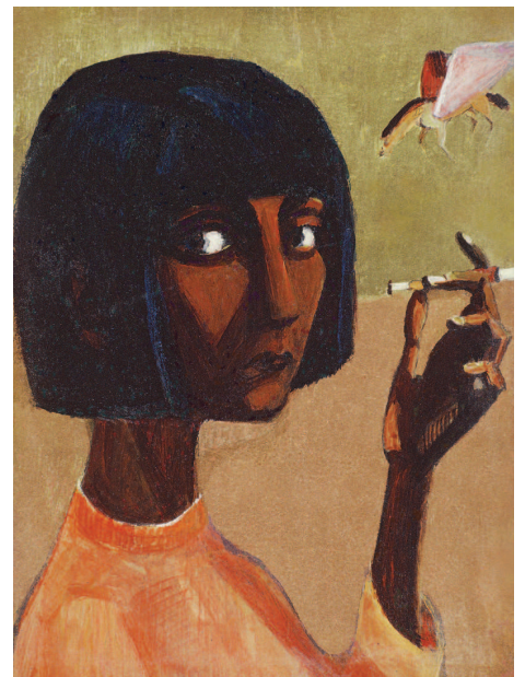
Nagy László: Szécsi Margit-ikon, 1977, akril, rétegelt lemez (Magántulajdon)