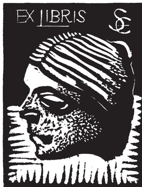
Soltra Elemér linómetszete, X3