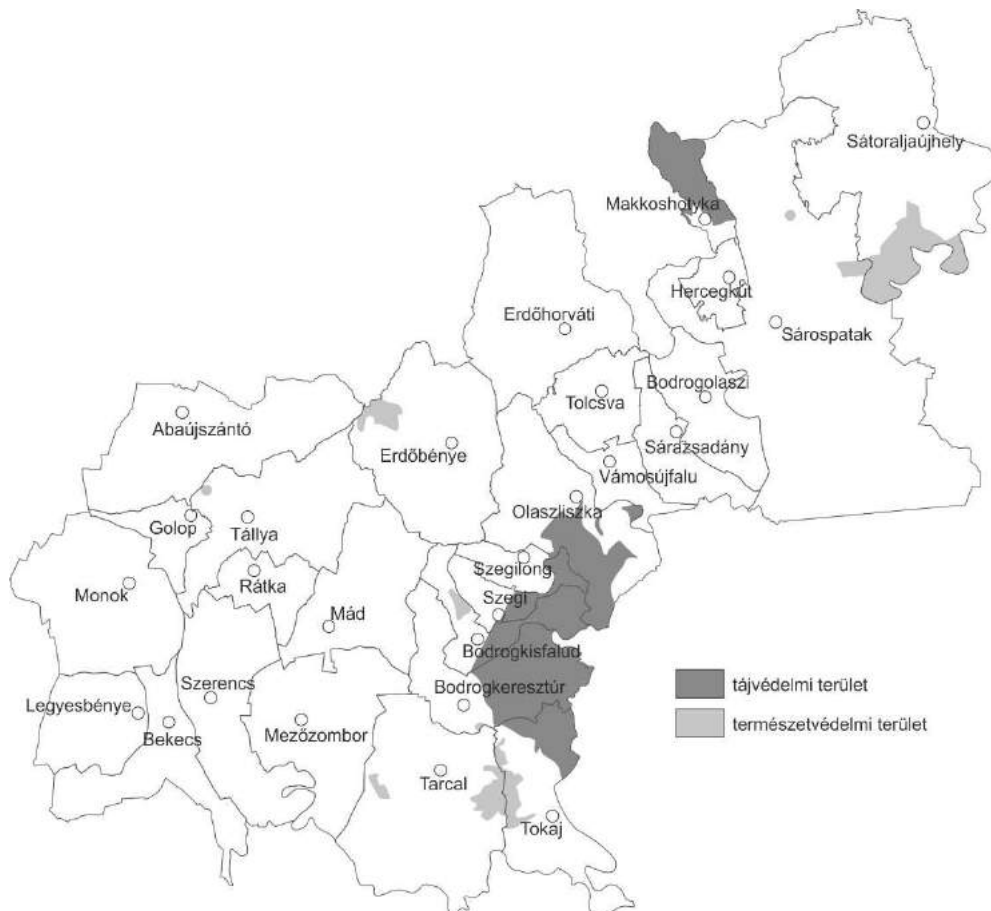
3. ábra: Természetvédelmi területek és tájvédelmi körzetek Tokaj-Hegyalján

A legnagyobb kiterjedésű természetvédelmi területek mellett, a fejlesztési koncepció által kiemelt jelentőségű természetvédelmi terület a Bodrogszegi Várhegy, a Megyer-hegyi Tengersizem, a Tállyai Patócs-hegy, valamint a Tarcali Turzó-dűlő. A növény-, és állatvilág megőrzésénél, fontos kiemelnünk a Natura 2000-es természet megőrzési területet, amely Tokaj-Hegyalja 12%-át foglalja magába, valamint a Madárvédelmi területek a terület 62%-át fedi le. (LUDA-VÁRADI 2016)