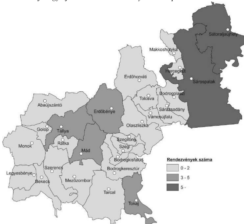
5. ábra: Tokaj-Hegyalja kulturális rendezvényeinek településenkénti eloszlása