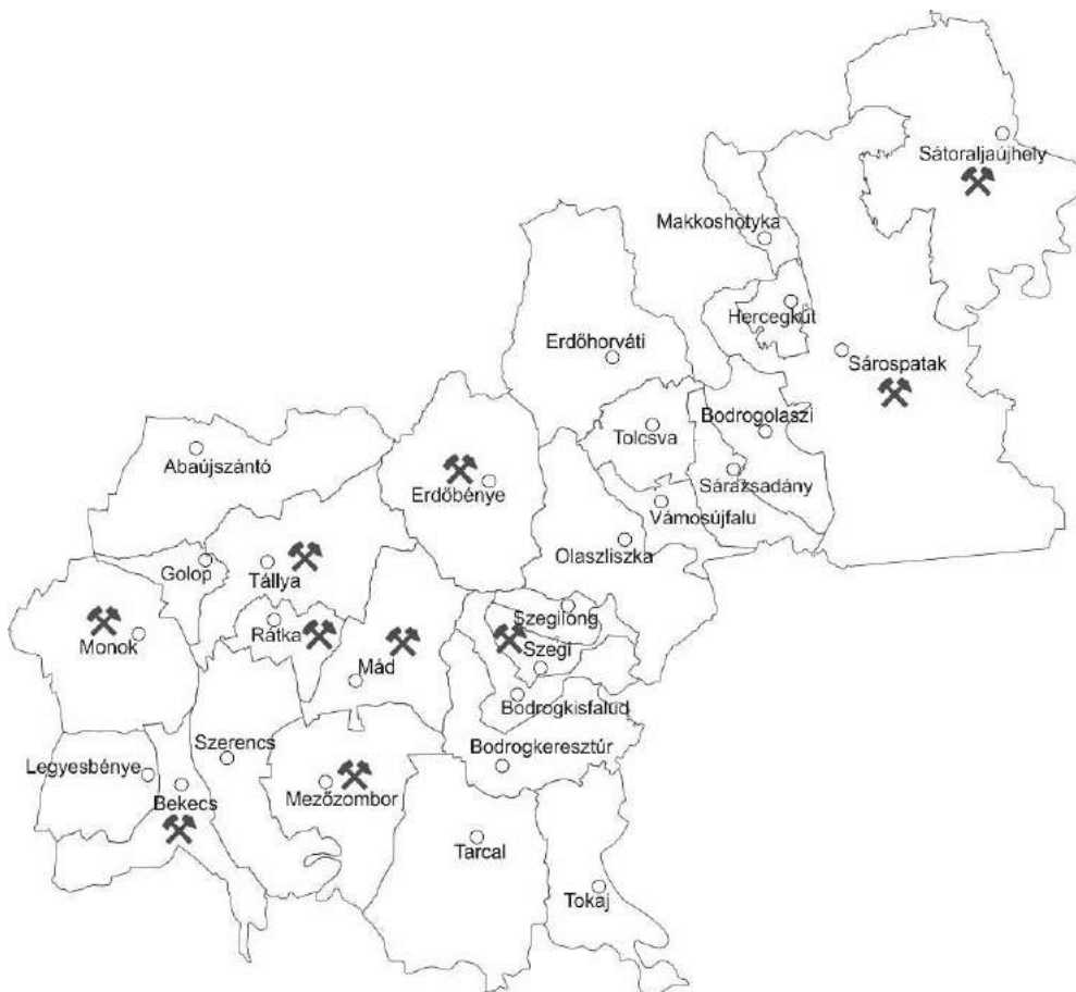
4. ábra: Ásványi lelőhelyek Tokaj-Hegyalján

Hazánkban az Országos Ásványvagyron Nyilvántartás alapján, Tokaj-Hegyalja és térsége különösen gazdag ásványi nyersanyagokban. A történelem során, de napjainkban is a bányászatnak jelentős szerepe van, hiszen a térségben élők közül 1000 főnek biztosít, munkalehetőséget. Geológiai szempontból 13 féle hasznosítható ásványi nyersanyag található a területen (például: kvarcit, kovaföld, kaolin, bentonit). Tokaj-Hegyalján 15 településen és 720 hektáron folytatnak bányászati tevékenységet, de Erdőbénye, Rátka és Tállya a legkiemelkedőbb. (FRISNYÁK-GÁL-HORVÁTH 2009)