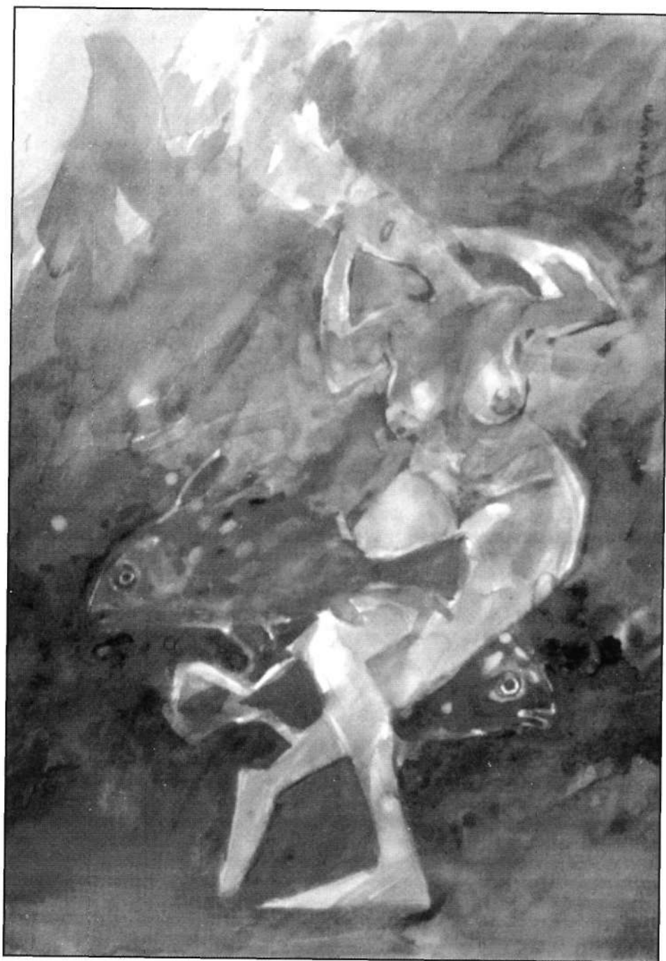
Víz alatti tánc