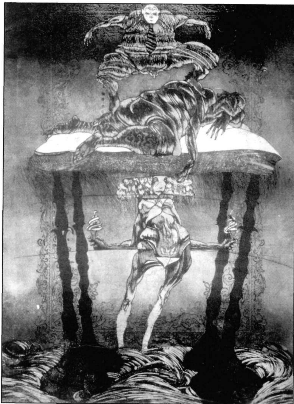
A császár és a halál