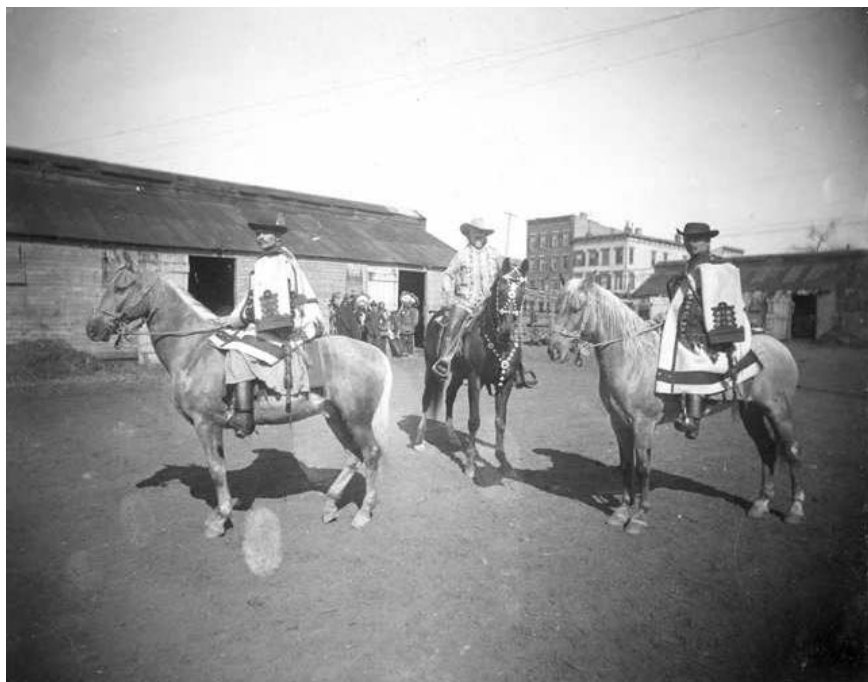
Buffalo Bill magyar csikósok társaságában

A kolozsvári Ellenzék zsrnalisztáját különösen felbosszantotta a cirkusz érkezése. Július negyedike után, miután a plakátozó csoport telerakta német–magyar nyelvű reklámokkal az egész várost, az összes kirakatot, hirdető oszlopot, olyannyira felháborodott, hogy mindjárt egy két oldalas cikket írt Buffalo Bill társulata ellen. Sérelmet látott abban, hogy a show műsora „ kilátásba helyezi a nagyérdemű közönségnek, hogy különlegességei sorában bemutatja a különböző vad népeket, azok szokásait, életmódját. Részük lesz a látogatóknak a kozákok, arabok, beduinok, mexikóiak elővezetésében, és a vad népek sorában be fogja mutatni a magyarokat is. ” 131 Ezen annyira megsértődött a cikkíró, hogy szitkokat