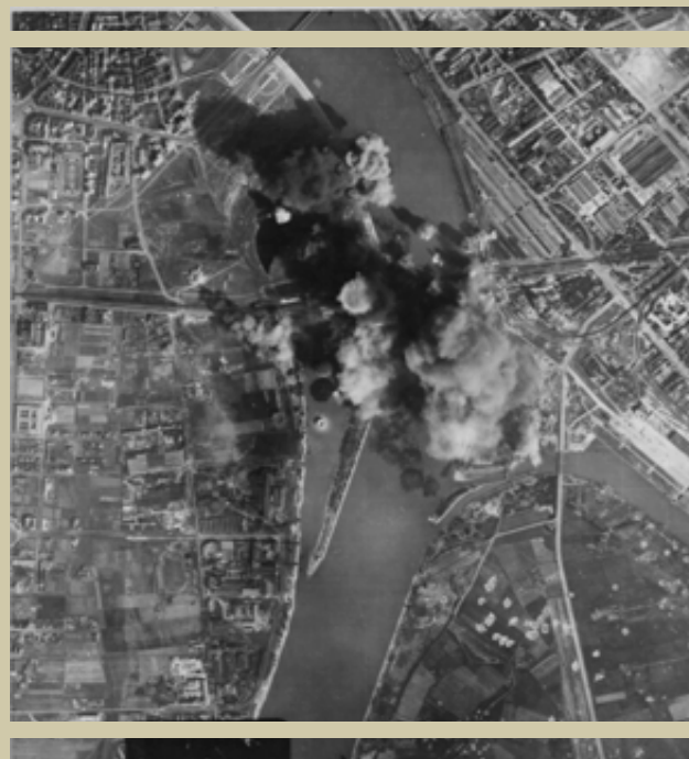
A 483. Bomb Group jól koncentrált bombaszőnyege a budapesti déli vasúti híd (ma Rákóczi híd) körül 1944. szeptember 5-én. A fotón láthatóak még a korábban a Csepel-sziget északi végében becsapódott bombák kráterei. A mai Weiss Manfréd úttól nyugatra eső részen észlelhetők egy másik sorozat nyomai, de a kráterek jóval kisebbek. Valószínűleg ezek egy korábbi támadás nyomai lehetnek, amely során kisebb méretű bombákat dobtak le, vagy elkezdték már betemetni őket.

Az amerikai bombák tömegét fontban határozzák meg (1 font = 0,4536 kg). Példaként az átlagos talajból egyetlen 500 fontos (kb. 250 kg-os) rombolóbomba a becsapódáskor az azonnal működésbe lépő csapódógyújtóval 4,4 méter széles és 1,5 méter mély, míg késleltetett gyújtóval 9 méter széles és 3,5 méter mély krátert is képes volt kirobbantani. A bombák gyújtásának (a csapódó orr-, vagy a késleltetett robbantáshoz a fénegyújtó) beállításait, valamint az alakulatok bombaterhét egyébként minden alkalommal a lehető legnagyobb pontossággal rögzítették a bevetés dokumentációjában. Súlyos tévedés, hogy az amerikaiak számolatlanul szórták volna a robbanószerkeket az ellenségre, sőt, minden egyes bombával szoros elszámolással tartozott a bombázó személyzet!