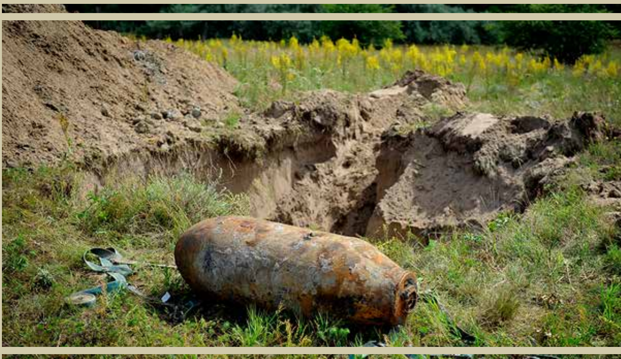
A budai Kamaraerdőnél földmunkák közben 2016. június 7-én előkerült 1000 kg-os, valamint a június 13-án az Infoparkból származó 500 kg-os amerikai bombákról készült fotók. Mindkét bombát a tűzszerészek semmisítették meg 2016. június 16-án, Dabasnál

A magyarországi régészeti terepi kutatások egyik legelső lépése minden esetben a megkutatni kívánt terület bomba- és lőszermentesítése. Ezek az alapvetően fémkeresős vizsgálatok elengedhetetlenek ahhoz, hogy a régészek biztonsággal vonuljanak fel az ásatási területekre, hiszen a jelentős földmozgatással is járó feltárások során a résztvevők testi épségüket, sőt életüket teszik kockára, ha előzetesen nem győződnek meg arról, hogy a földmunkagépekkel és kézi szerszámokkal való bolygatás során nem kerülnek-e fizikai kapcsolatba bombákkal, robbanó- és lőszerrel. Ilyeneket ugyanis rendkívül nagy számban rejt magában a föld a mai Magyarország területén, leginkább a II. világháború keserves örökségeként.