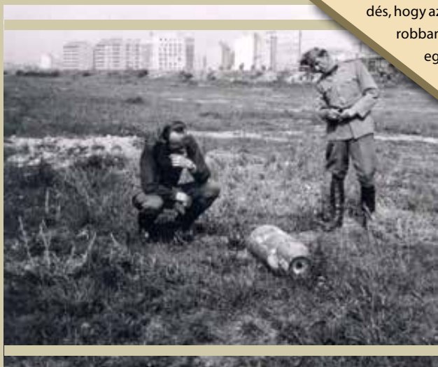
Magyar katonák vizsgálják egy fél nem robbant amerikai bombát Pétnél, 1944. június 14. körül

A hazai tüzserészekhez évente mintegy 2500 bejelentés érkezik, ezekből pedig minden harmadik esetben az előkerült robbanószerkezetek közvetlenül veszélyeztik az emberi életet. Ezek között a szerkezetek között szép számmal találhatók a II. világháborús légi harcokból visszamaradt amerikai repülőbombák is, amelyek közül szinte minden nagyobb régészeti feltárás és építkezés földmunkái során előkerül egy-egy darab. Az alábbiakban ezekről a tengerentúlról származó korántsem „kedves küldeményekről” emlékezünk meg.