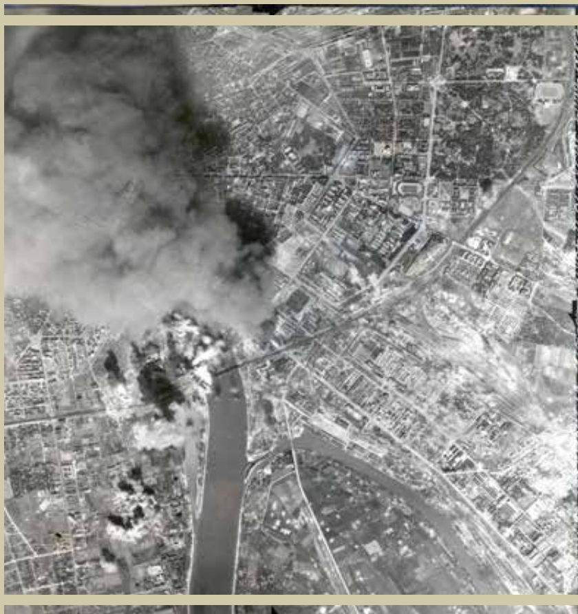
A 459. Bomb Group célfotója 1944. szeptember 18-án 11.46-kor 6.690 méter magasságból. A célponttól, a budapesti déli vasúti hídtól északkeletre eső folyóparti sávot letarolta egy elcsúszott bombaszőnyeg. Figyelemreméltó, ahogy a Duna és a Ferencvárosi pályaudvar közötti városrészt a korábbi támadások szintén letarolták.

bomba robbanás nélkül fúródott a talajba, sokszor a befuródási nyílás körül tölcser helyett csak egy bombavájta, cső formájú furat keletkezett, s a nyílás gyakran betömődött, a bombatest pedig igen gyakran 2-3 méterre is elcsúszott oldalirányba. Ne felejtjük el azt sem, hogy a támadók több ezer méter magasságból oldották ki a bombaterhüket, így azok hatalmas energiával vágódtak be a talajba! Könnyen megeshetett, hogy a sok bombakráter között a tüzserészek a befulladt robbanószerek becsapódási nyílását sem tudták azonosítani vagy megközelíteni, nemhogy a mélyen a talajba fúródott és egyébként is a becsapódás helyétől „elcsúszott” bombakét. A bombakrátereknél mindig sok repeszdarab volt fellelhető, aminek hiánya árulkodó jel lehetett egy fel nem robbant bomba esetén, azonban az amerikai légitámadások tömeges bombavetéssel jártak, így a lebombázott helyszínt igen gyakran más bombákból származó repesz borították be.