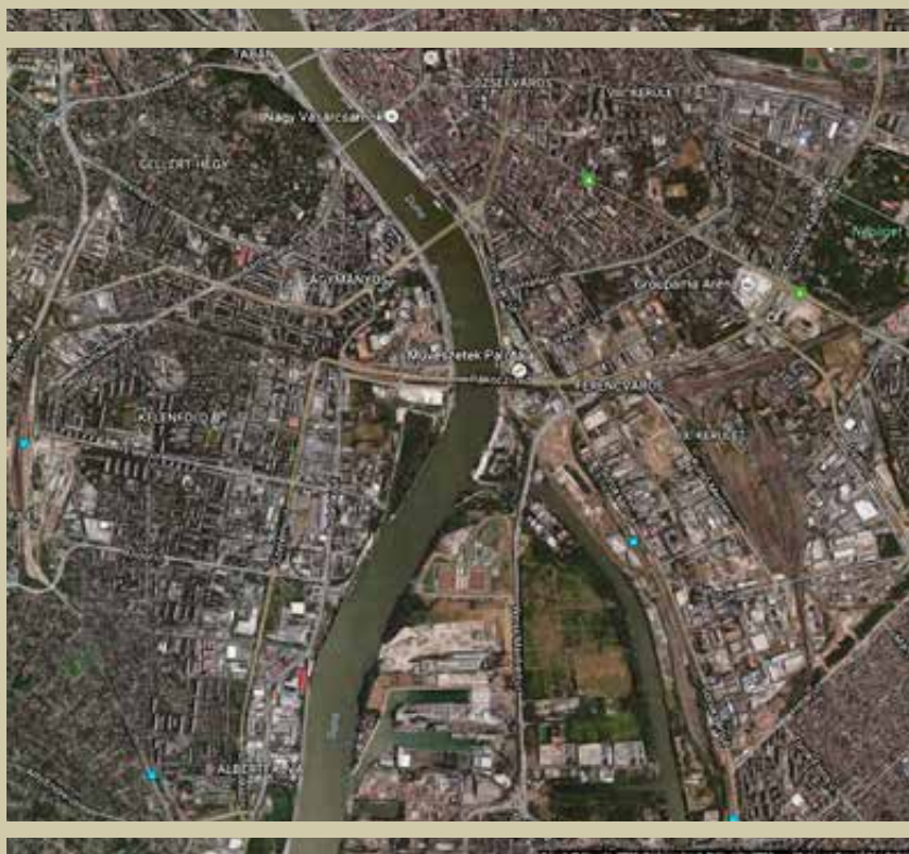
A Rákóczi híd környékén a Művészetek Palotája és a Nemzeti Színház területe az egykori amerikai bombaszőnyegbe esnek, de a Kopaszi-gát környéke is erősen „szennyezett” lehet

A Magyarország ellen irányuló amerikai légitámadások zöme 1944. április 3-tól 1944 októberéig lezajlott, ezért a magyar közigazgatás még ezekben a hónapokban a befulladt (tehát fel nem robbant) bombák többségét regisztrálhatta, s ez vissza is tükröződik a korabeli jelentésekből. Ugyanakkor a ma is nagy számban előkerülő bombák már önmagukban is azt bizonyítják, hogy az akkori szakemberek nem végeztek tökéletes munkát. Ha egy