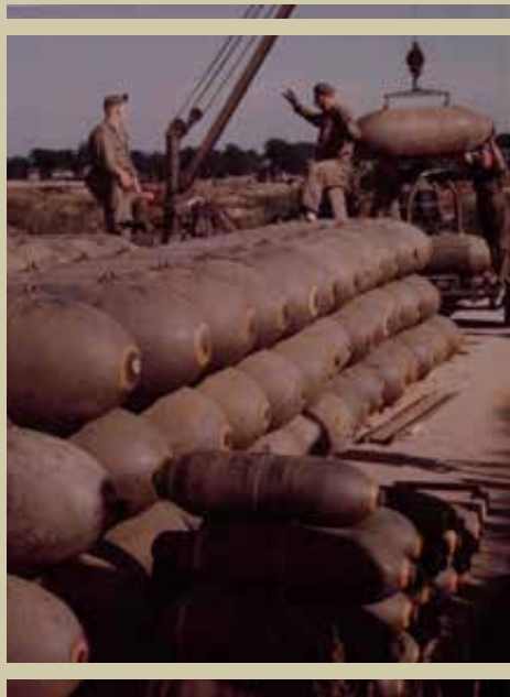
Az amerikai légierő bombamesterei munka közben

Az említett időszakban, tehát a világháború alatt a lőszermentesítést a katonák mellett a légoltalmi tűzszerészek végezték. Ők elsősorban azokat a területeket tisztították meg, ahol emberéletek forogtak közvetlenül veszélyben. A magyarországi szárazföldi harcok megindulását követően azonban olyan túlterheltségben végezték kiemelten veszélyes feladatukat, hogy a levegőből ledobott összes amerikai bomba hatástalanítására és elszállítására már nem maradt kapacitásuk. Ezért 1944 folyamán többször is el kellett rendelni a fel nem robbant bombákkal való eljárás betartatását, amelynek értelmében a szakemberek mellett mindenki másnak szigorúan tilos volt hozzányúlnia az ilyen hadianyagokhoz. E törekvések ellenére sajnos több olyan szerencsétlenség is történt akkortájt, ami a bombák szakavatlatlan szétszerelése miatt következett be.