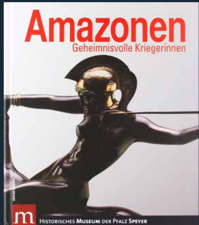
Az Amazonen című kiállítás katalógusa

Az amazonkutatók az ókori írott források mellett két fő forráscsoportra támaszkodnak: képi ábrázolások és a természettudományos eszközökkel felvértett régészeti eredmények. Leginkább utóbbiak adtak új lendületet az ókori fegyveres nők kutatásának. A Theodore Antikas vezette görög kutatócsoportnak néhány éve sikerült hitelt érdemlően bizonyítani, hogy a II. Fülöp makedóniai uralkodó – Nagy Sándor apja – mellett eltemetett harcos