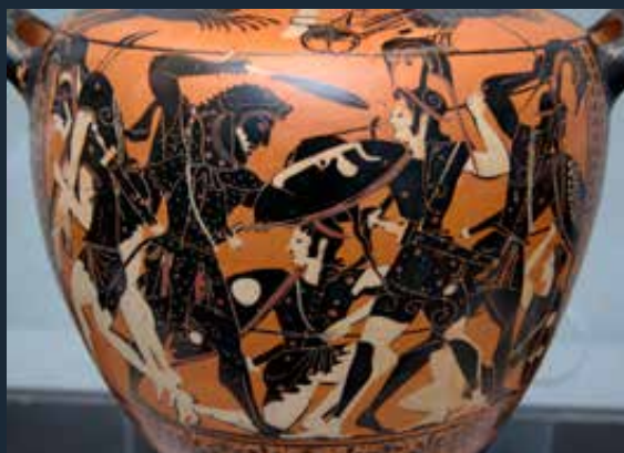
Héraklész/Herkules harca az amazonokkal