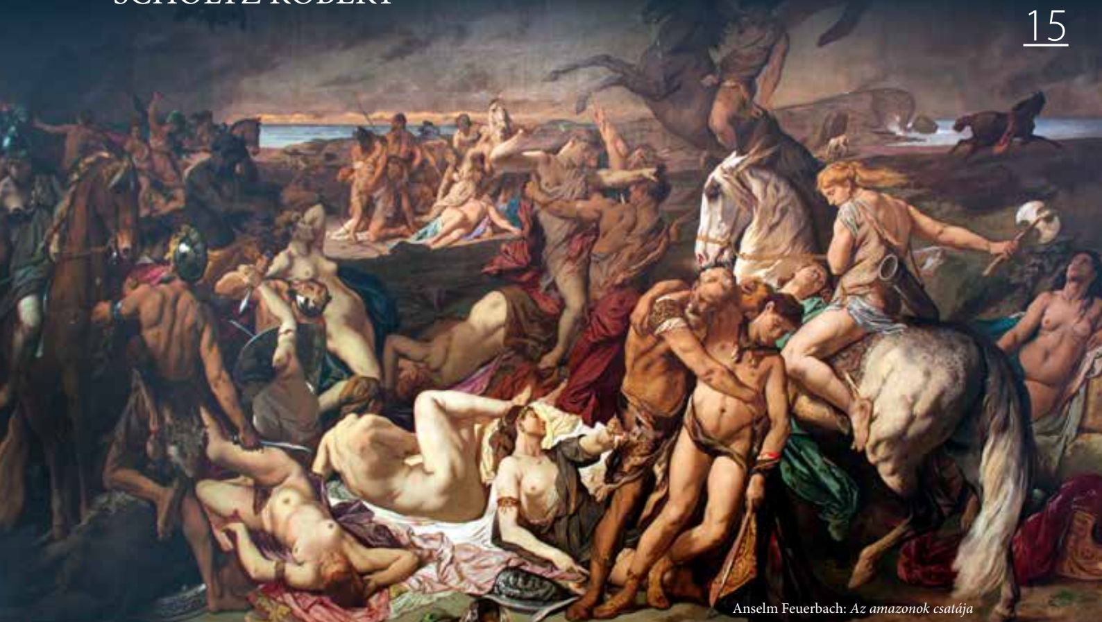
Anselm Feuerbach: Az amazonok csatája

„Réges-régen történt, hogy a szkúthák földjén olyan korszak köszöntött be, amikor nem voltak királyok, és asszonyok ragadták magukhoz a kormányzás gyeplőjét; ezek a nők kitűntek bátorságukkal és testi erejükkel. E népeknél ugyanis az asszonyok is részt vesznek a harci gyakorlatokban, akárcsak a férfiak, és bátor tettekben sem maradnak el a férfiak mögött, miért is e kiváló asszonyok sok csodás dolgot vittek végbe, mégpedig nemcsak a szkútháknál, hanem a szomszédos népeknél is.” – Diodórosz