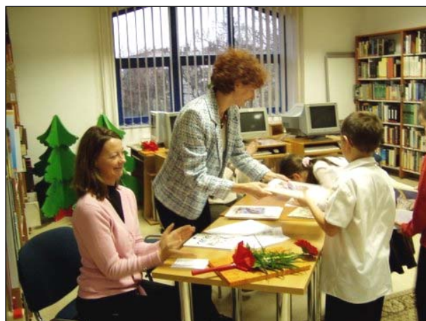
A Pais Dezső iskola tanulóinak műsora