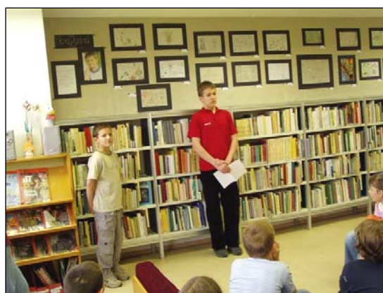
Vörös Zoárd: Az én világom (Eötvös József Székhelyiskola, Zalaegerszeg)