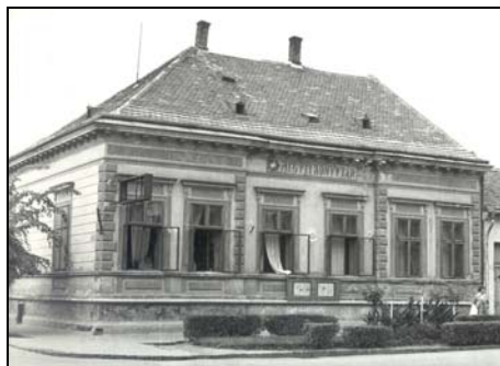
A zalaegerszegi Körzeti Könyvtár, majd Mezei Könyvtár épülete