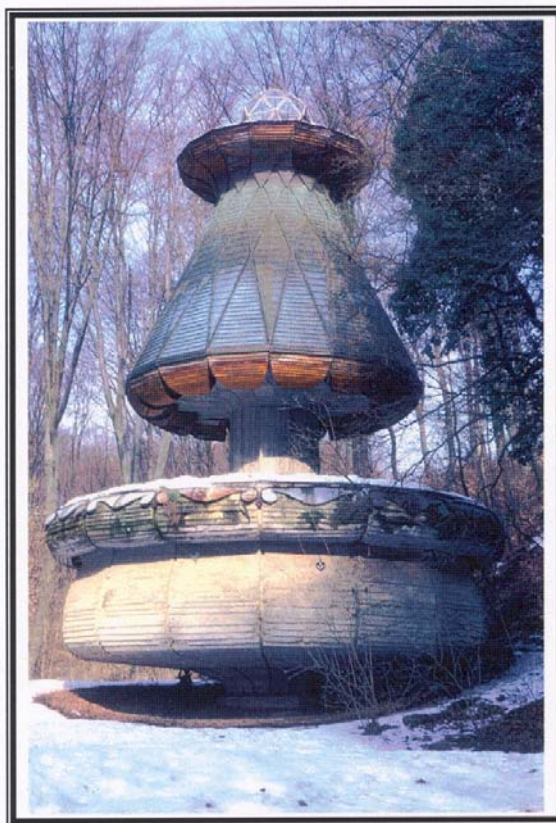
1. kép: A Gomba (szivattyúház) Picture 1. The „Gomba” (house of pump)

A Vízfő-forrás barlangja a többi idegenforgalmi barlanghoz képest nem jelentős nagyságú, ezt azonban ellensúlyozza a rendkívül kedvező fekvése, különösen a jó megközelítési lehetősége és a kapcsolódó, már működő idegenforgalmi létesítmények közelsége. A viszonylag kis méret mellett értéke az is, hogy a barlanghoz tartozik, a barlanggal szorosan és szervesen együtt található „Gomba” nevű objektum, amely védett ipartörténeti emlék (Csete György egyik remek alkotása) (1. kép). A „Gomba” és a szivattyúház szerves egységet képez a barlanggal, hiszen a vízkiemelés céljára építettek itt