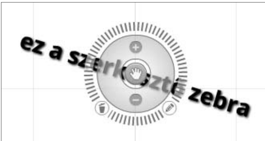
3. ábra. A Prezi szerkesztő zebraja a forgató opcióval

A Prezi újdonságát valójában csak akkor lehet igazán értékelni, ha ki is próbáljuk, hogyan működik mindez. Az ebben a rovatban korábban megjelent cikkek többségében illusztráltuk a programokat. A Prezit azonban igazából élőben lehet csak illusztrálni, mivel lételeme a mozgás, a ráközelítés, a forgás, a teljes vászon és a kis részletek közötti rugalmas, az előadás folyamatát, logikáját követő, jól látható, eredeti, izgalmas kapcsolat.